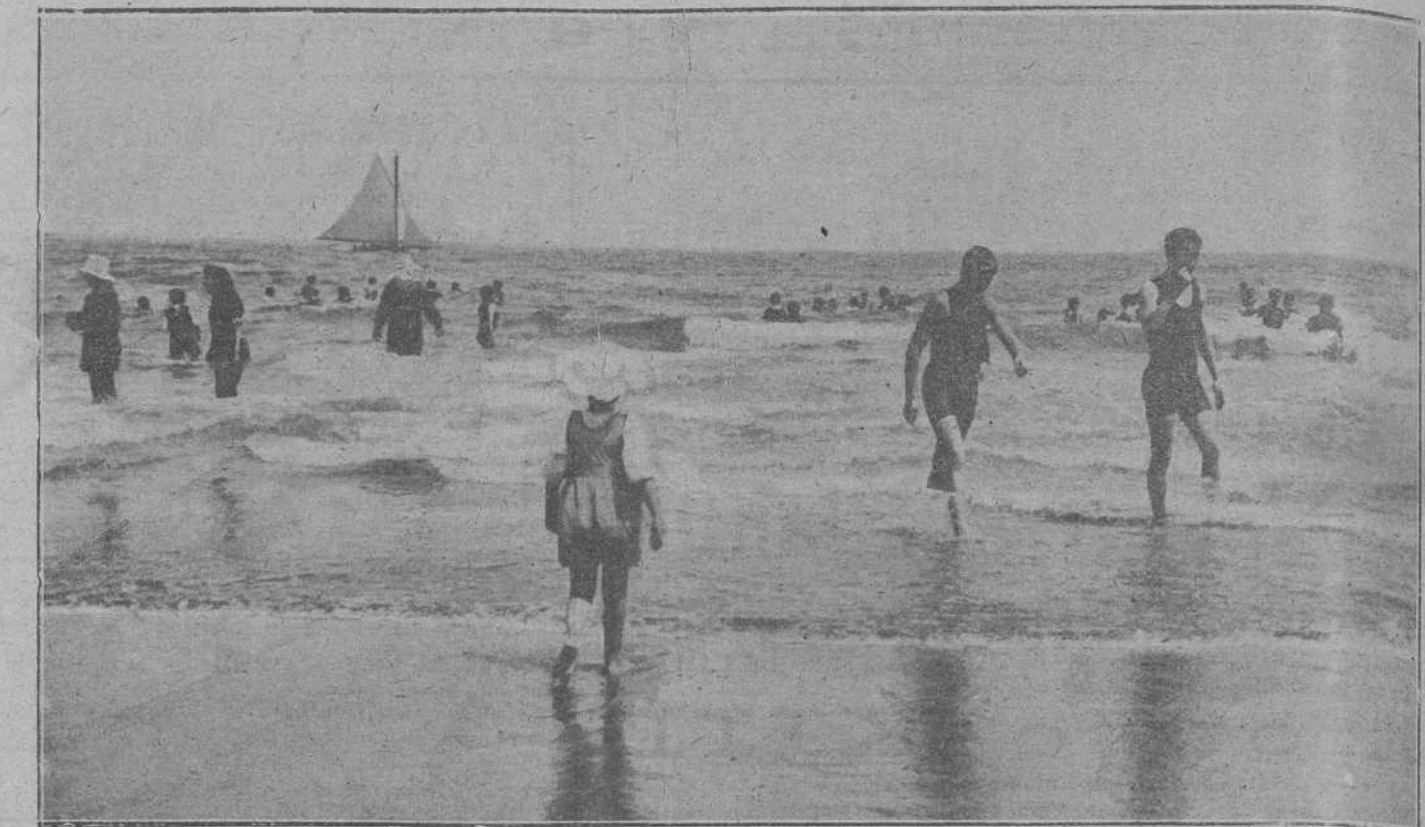
EL VERANEO EN SANTANDER.—Escena en la playa del Sardinero, sorprendida por el notable aficionado señor Araña.

subvencionada, podía llegarse fácilmente a un precio de 2.242.710 pesetas más que en igual período del año anterior, y que en los tres últimos meses, no obstante la baja en Aduanas, se han recaudado 20.806.316 pesetas más que en igual trimestre del año anterior.