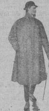
Gabán inglés impermeabilizado, resistente a la lluvia: 85 pesetas.

NOTA.—Se confeccionan trajes para señora, enviando un cuerpo ajustado y medidas, y se sirven con gran rapidez todos los encargos.