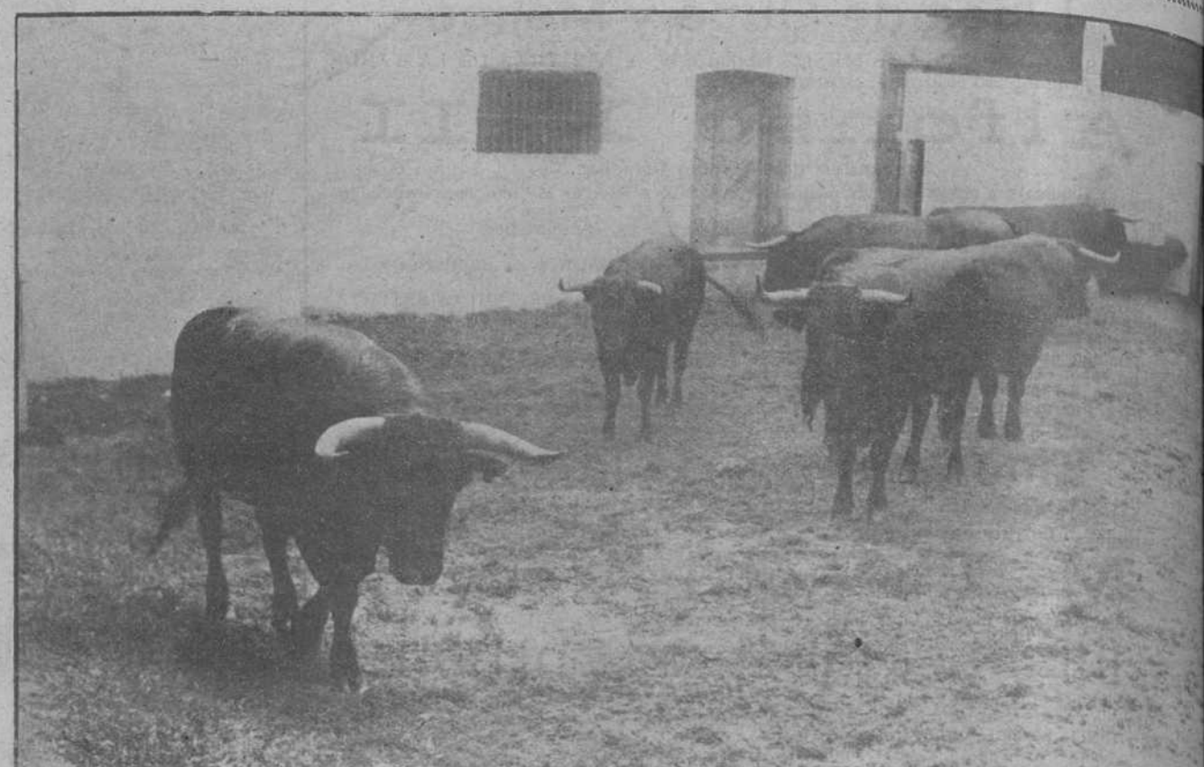
Los seis toros de Uroala que se jugarán esta tarde.

Por la noche, a las diez, tercera función de abono, el entremés de los señores Alvarez Quintero, «Sangre gorda», y rees.