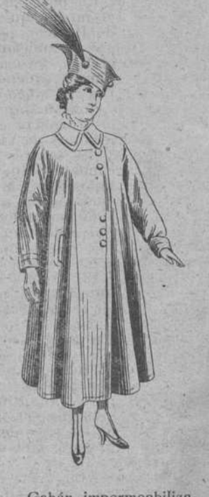
Gabán impermeabilizado, modelo 1916 y 1917. Precio: desde 90 pesetas.