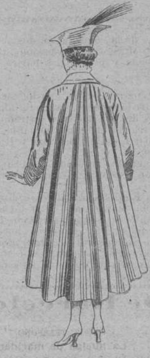
Gabán impermeabilizado inglés, resistente a la lluvia. Modelo de la temporada de otoño e invierno de 1916 y 1917: desde 85 pesetas.

Modelos de trajes y abrigos de las Casas Bernard, Drecoll, Gallot y Lleny, de París, Modelos de gabanes impermeables e impermeabilizados de las Casas Birabann, de Londres, y Stron, de París, para señoras y caballeros.