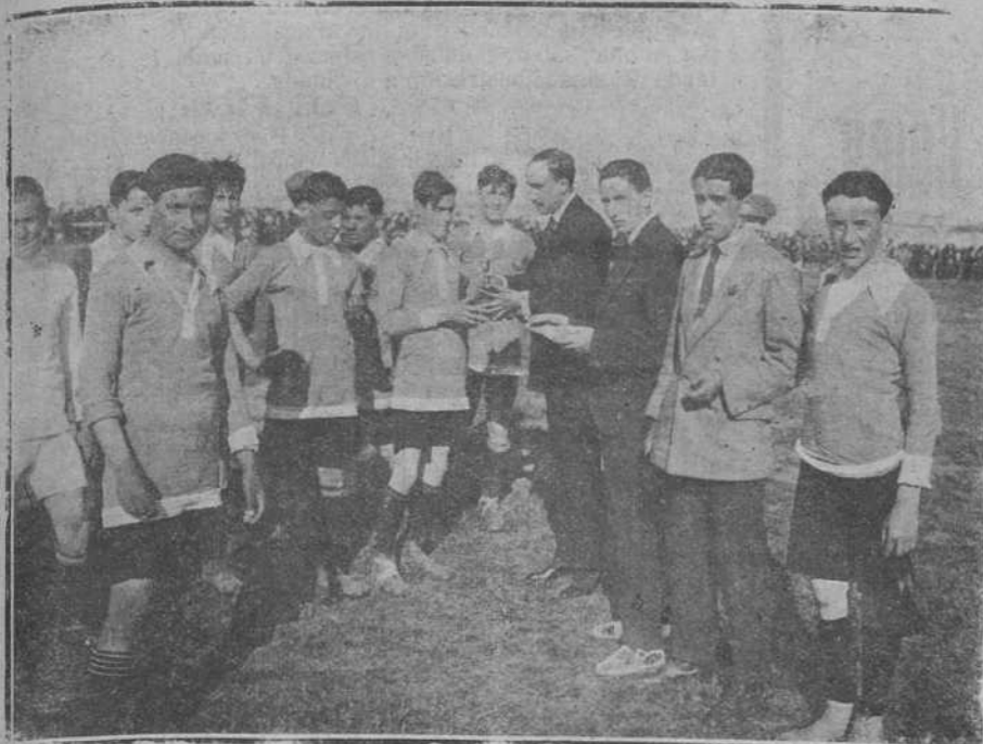
El presidente del «Racing Club» entregando la Copa Racing al equipo campeón «Siempre Adelante».

La tarde de ayer es de las que dejan recuerdo para toda una vida futbolística. El aspecto que ofrecían los campos de Sport era de lo más hermoso que se ha visto. Bien es verdad que el programa era como el de ayer, y para algo más. Además, se trataba de un fin benéfico, y a las llamadas que el «Racing» hizo al pueblo de Santander, para recaudar con su ayuda fondos para engrasar la caja de la Asociación «La Caridad», aquí, respondió. Ayer el pueblo santanderino dio con creces prueba de ser caritativo, asistiendo a presenciar el festival organizado por nuestro «Racing Club».