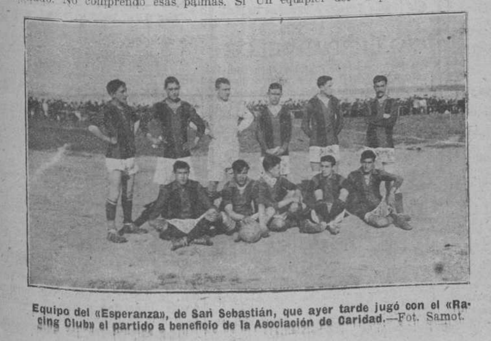
Equipo del «Esperanza», de San Sebastián, que ayer tarde jugó con el «Racing Club» el partido a beneficio de la Asociación de Caridad.