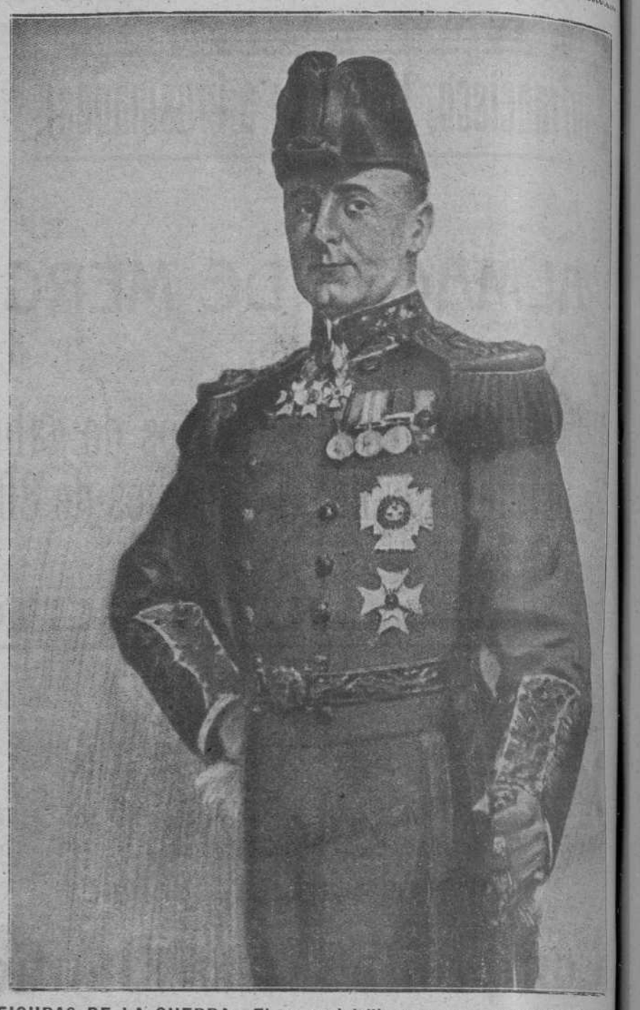
FIGURAS DE LA GUERRA.—El general Jellicoe, que manda la escuadra del mar del Norte, una de cuyas divisiones ha sido derrotada en Skagerak.