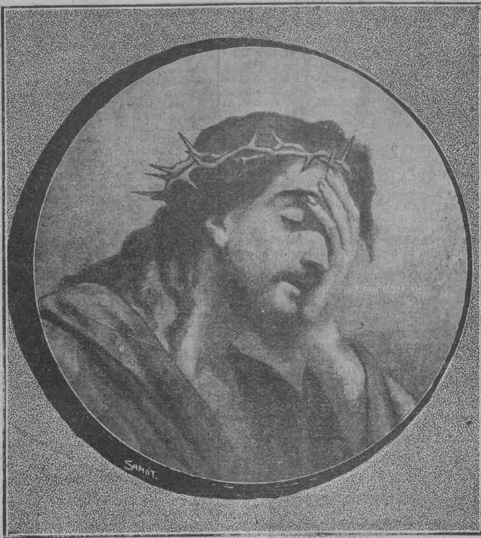
Jesús coronado de espinas. (Cuadro de Juan Syckl.)