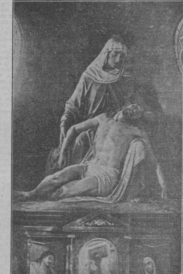
EL DESCENDIMIENTO.—Grupo escultórico que se venera en la iglesia de Liendo.