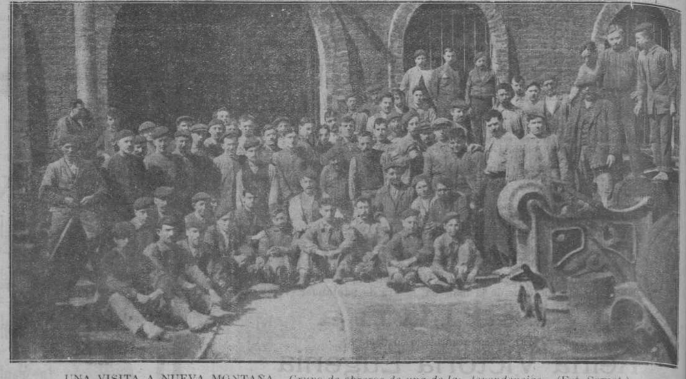
UNA VISITA A NUEVA MONTAÑA.—Grupo de obreros de una de las dependencias.

Para impedir que los albidillos consigán sus propósitos, basta con cumplir la ley de Subsistencias, pues así se evitaría que pueda reproducirse lo ocurrido en