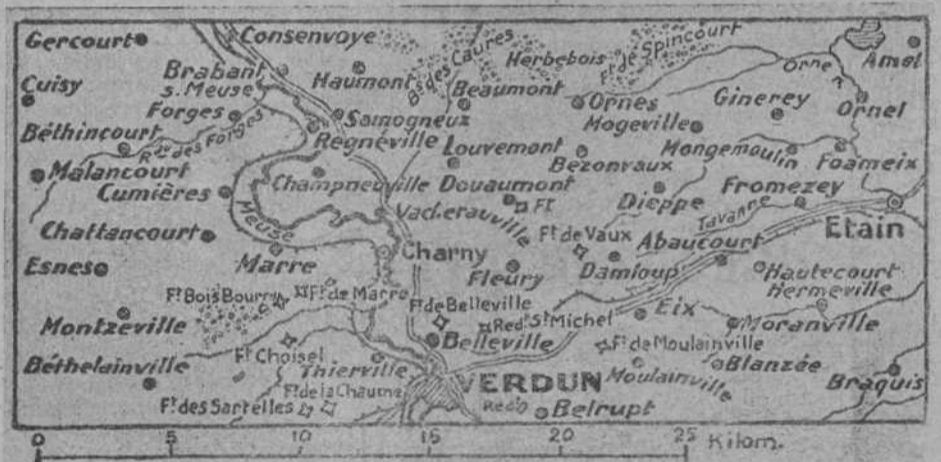
PLANO DE LA REGION AL NORTE DE VERDUN, DONDE ACTUALMENTE SE LIBRAN ENCARNIZADOS COMBATES.

Consetipados.—Algodón HORLAND, véase anuclio en cuarta plana.