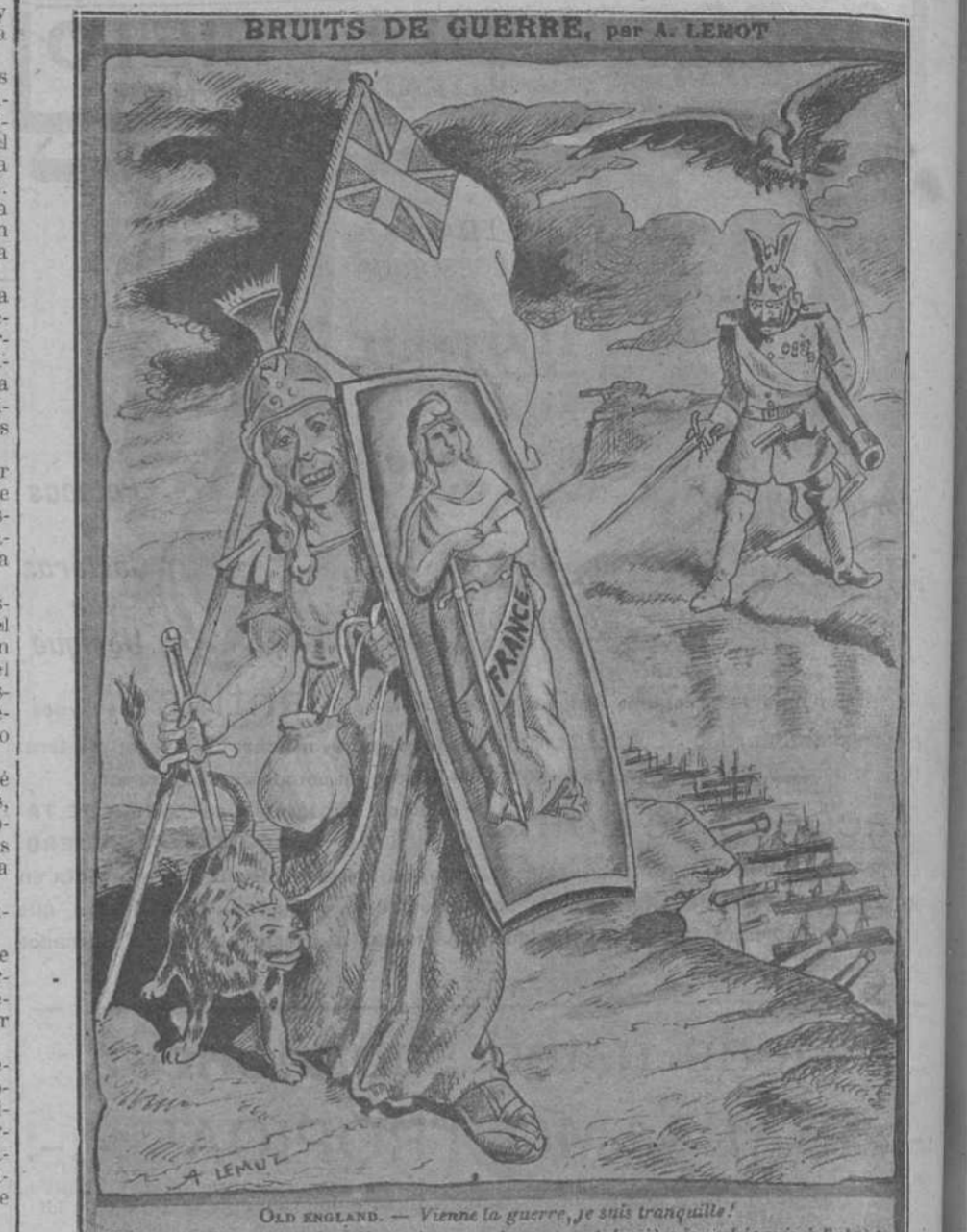
COMO SE PRESENTA EN FRANCIA LA GUERRA HACI NUESTROS AÑOS.—La Vieja Inglaterra: Tenga la guerra; estoy tranquila. He sabido procurarme un escudo que recibirá todos los golpes y tras el cual estoy al abrigo. (De Le Pelerin, de 1907.)