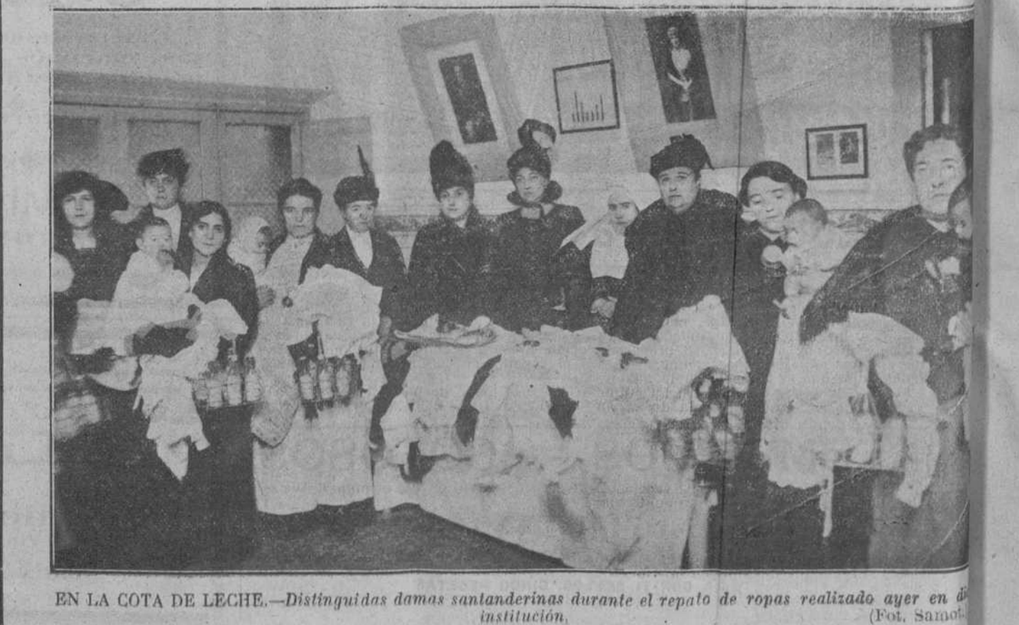
EN LA COTA DE LECHE.—Distinguidas damas santanderinas durante el reparto de ropas realizado ayer en la institución.

Por teléfono MADRID, 6.—El día ha sido espléndido y todo el vecindario madrileño ha invadido los paseos, presentando Madrid un aspecto animadísimo. Las fiestas de Reyes, celebradas por el Centro de Hijos de Madrid, Asociación de obreros y empleados de Tranvías y en los Asilos y Corral de Mujeres, han estado concurridísimas. En el Salón Doré se ha celebrado el reparto de juguetes organizado por la Juventud Maurista, resultando el acto brillantísimo por la gran cantidad de valiosos juguetes repartidos. Después del reparto fueron obsequiados los pequeños con varias películas cómicas. En el Centro Maurista del Obrero, del distrito de la Inclusa, se celebró también con gran brillantez el reparto de 1.000 juguetes a los hijos de los socios y a los niños pobres del distrito. ¿Queréis tomar tomate o pimientos extra? Comprad siempre los de marca ULECIA.