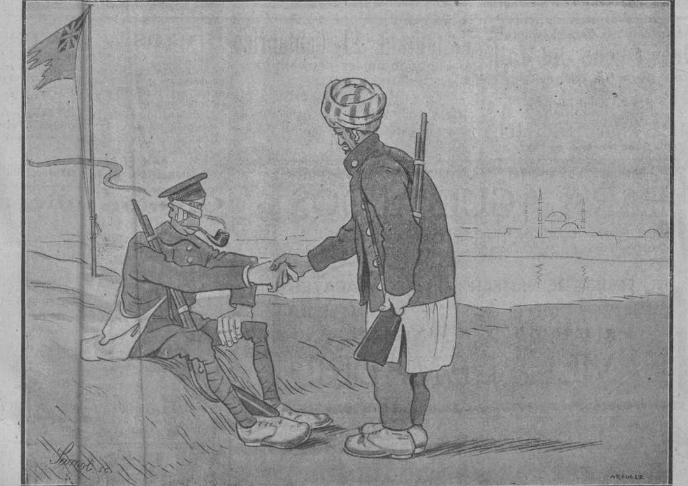
«Atiende, señor inglés, y recomiéndale a tus hermanos que imiten mi docilidad. Pero si desde el principio de la guerra no hacemos más que imitarlos! ¿No nos hemos tiado la manta a la cabeza, como vosotros? ¿No estamos «haciendo el indio», como vosotros también...?»