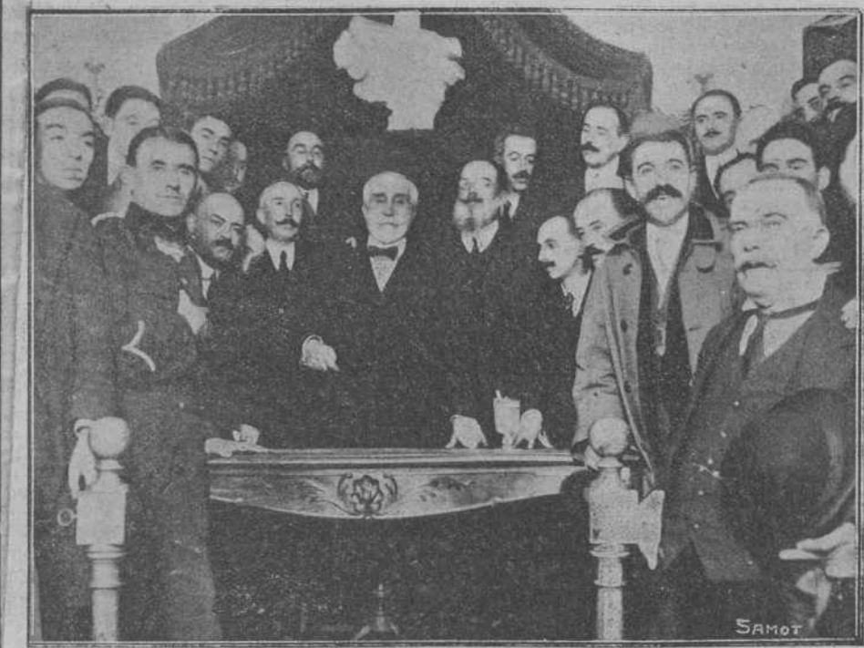
MADRID.—INAUGURACION DEL CENTRO MAURISTA DE CHAMBERI.—Don Antonio Maurá rodeado de los oradores y algunos asistentes al acto, después del magistral discurso que pronunció.

lo era el ministro de Hacienda, que había juzgado indispensable para él la aprobación inmediata de los presupuestos.