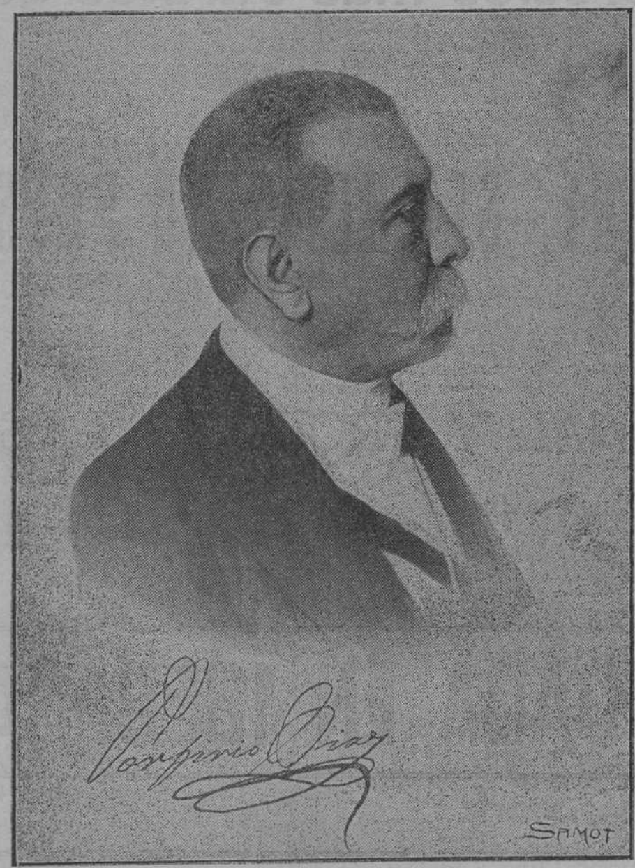
EL EX PRESIDENTE DE LA REPUBLICA DE MEXICO, DON PORFIRIO DIAZ, QUE SE HALLA GRAVEMENTE ENFERMO EN PARIS

«Durante la noche del 24 y todo el día siguiente ha continuado el duelo de artillería.