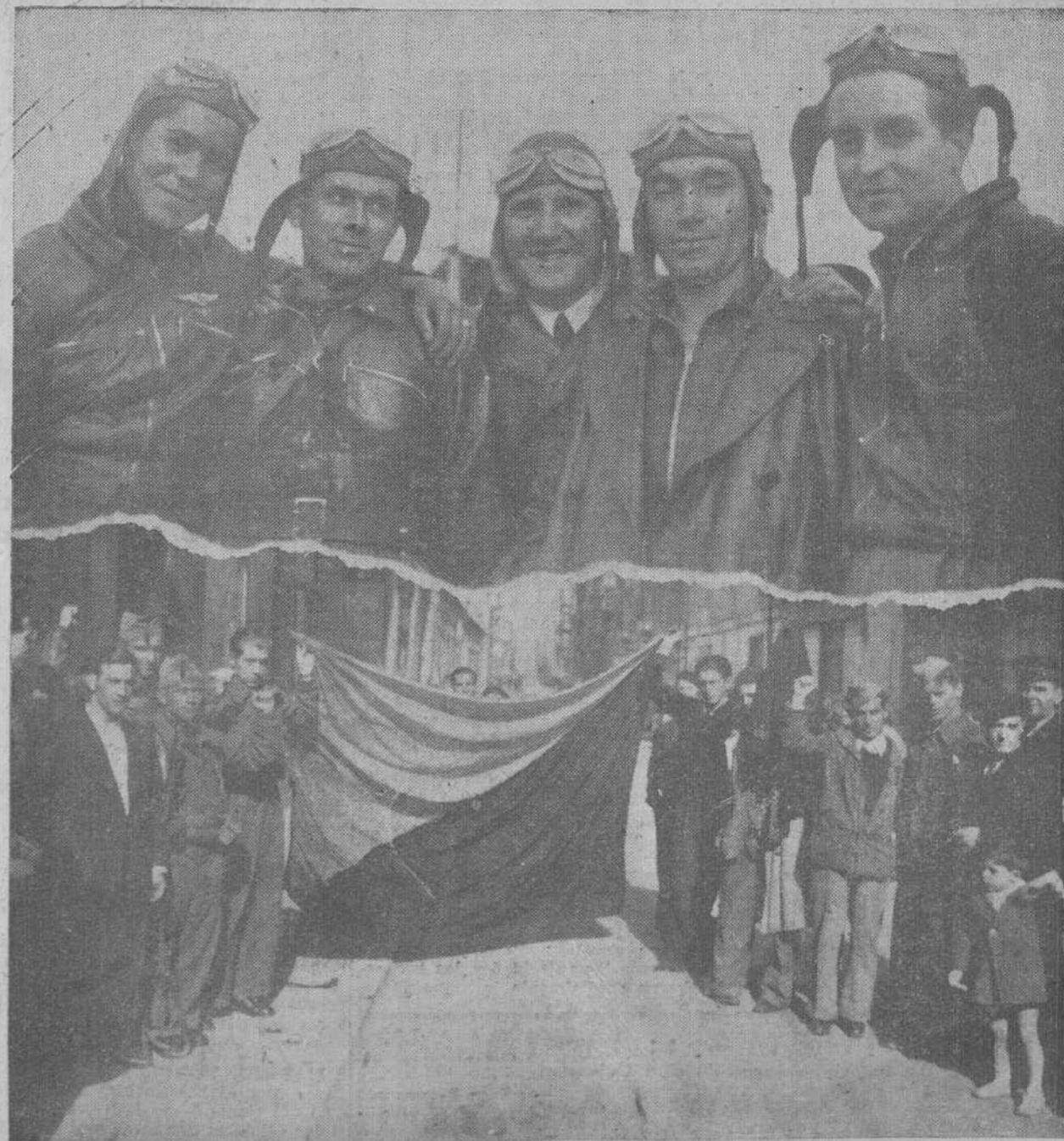
Grupo de aviadores republicanos que intervinieron ayer en la destrucción del acorazado «España».—Una de las banderas de señales que dejó sobre las aguas el buque hundido.—Un muchacho que aparece en la foto ostenta la guerrera de un capitán de corbeta, hallada en las inmediaciones del lugar donde ocurrió el hundimiento del acorazado «España».

Cuando más confiados estaban en su tiroto contra los cazas, uno de ellos, en magnífico alarde de precisión y valentía, arrojó algunas bombas sobre el buque, internándose una de ellas so-