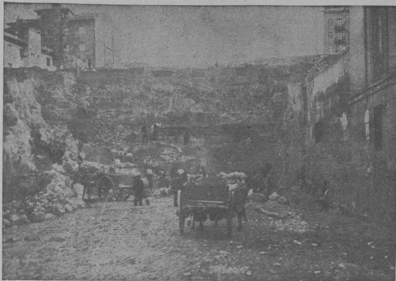
Estado actual de las obras del Tunnel del Pueblo, donde, según la referencia de la Alcaldía, dentro de pocos días se colocará la primera piedra con asistencia de las autoridades.