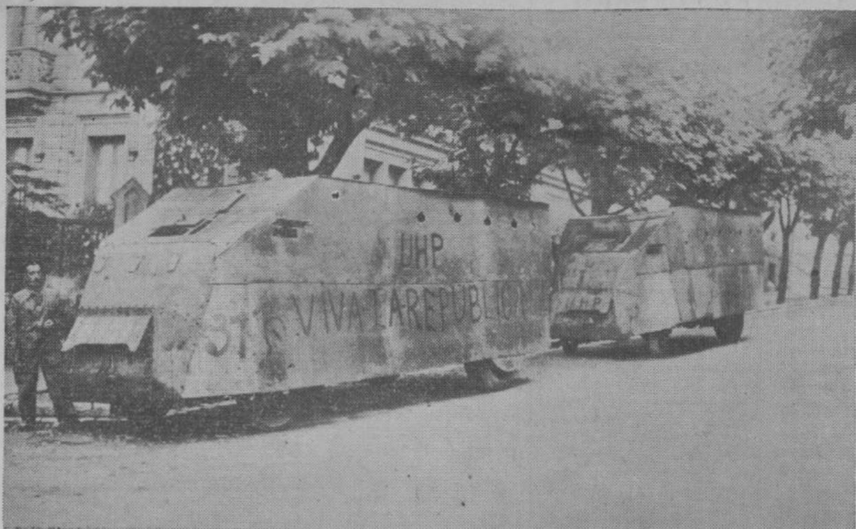
Autos blindados construidos por los entusiastas obreros de la Casa Corcho para los valientes camaradas que luchan contra los facciosos.