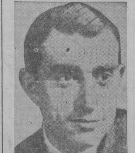
ANTONIN MAGNE. Conductor de automóvil. Evita en el casco urbano el uso de las señales de aviso y los ruidos innecesarios del motor.

La salida se dará a las diez y media de la mañana, para llegar a Marsella a las cuatro y media aproximadamente.