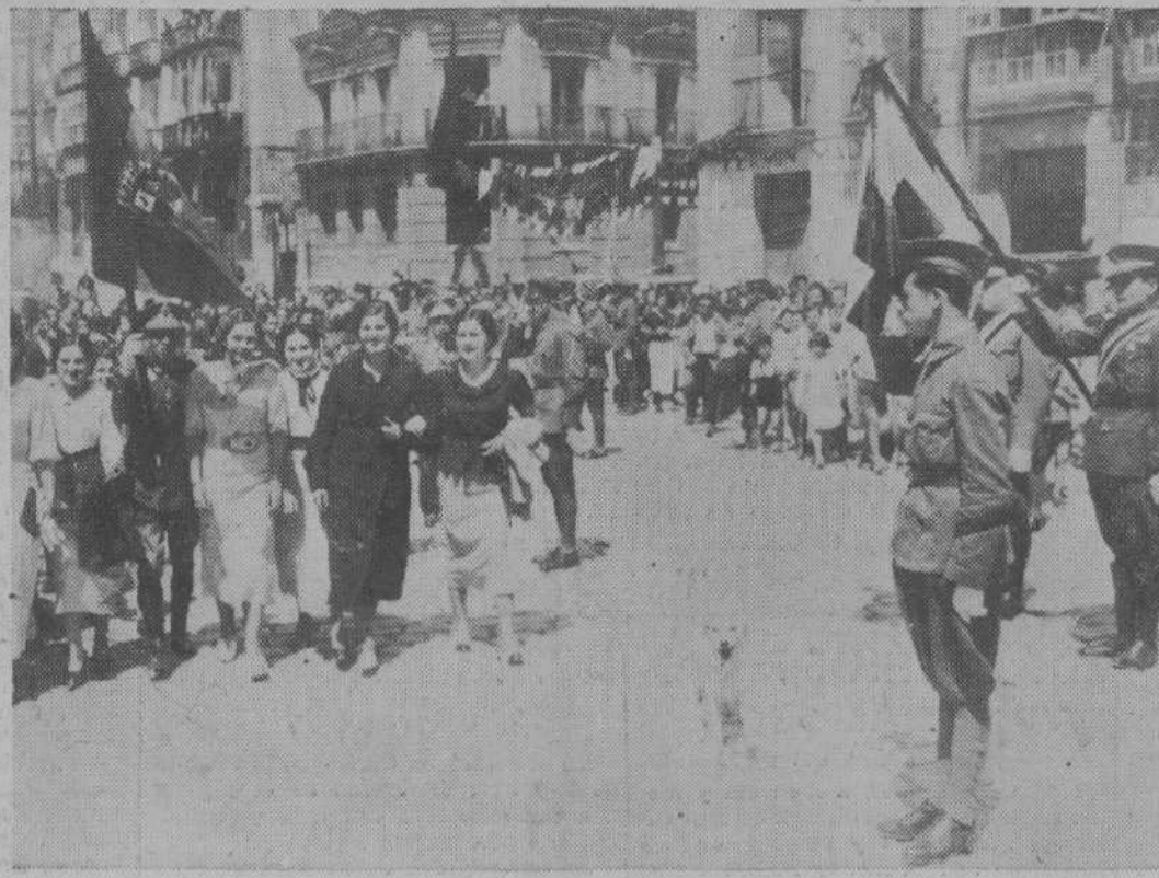
DE LA ENTREGA DE LA BANDERA A LA CRUZ ROJA.—El abanderado, portando la nueva enseña de la Institución, avanza, con la grata escolta de un grupo de bellas señoritas, para incorporarse a las fuerzas.

—En cuanto a los otros naufragos, tampoco hay nada nuevo, sin haberse encontrado un solo cadáver de los tripulantes desaparecidos de la vapora «Joven República» y demás embarcaciones que sufrieron las terribles consecuencias de la galerna.