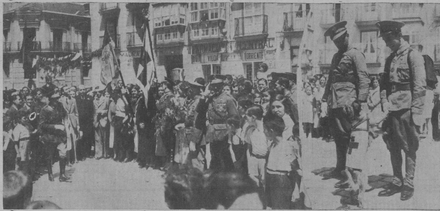
Entre la Comisión de bellas señoritas del barrio de la Enseñanza, los dos oficiales de la Cruz Roja sostienen en alto la bandera nacional y la de la Institución, que acaban de otorgarles.—Las fuerzas formadas, hasta el perro mascota de la institución se alinea disciplinadamente.

A las diez y media de la mañana se celebró el domingo el simpático acto de la entrega a la Cruz Roja local, por las mujeres del barrio de la Enseñanza, de la bandera costeada por suscripción popular.