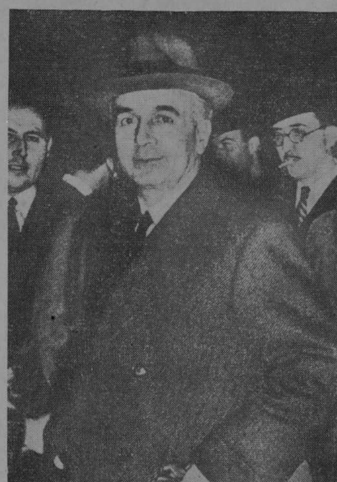
ESPAÑA EN LA SOCIEDAD DE NACIONES.—Procedente de Madrid y París se encuentra en la capital inglesa don Augusto Barcia, ministro de Estado del Gobierno español, que asiste a las reuniones y deliberaciones de la Sociedad de Naciones en los trascendentes asuntos que tanto preocupan hoy al mundo entero.

encontraré jamás molde mejor que un régimen parlamentario. Termina creyendo que las Cortes sabrán cumplir con su deber. «El Debate». Se refiere a la constitución del Parlamento y dice que ha ocurrido en circunstancias particularmente críticas, pues hace un mes que dura el colapso de la vida nacional. Las Cortes son el resultado de lo que el país sentía en los alrededores del 16 de febrero. La opinión se manifestó entonces dividida en dos grandes grupos, numéricamente casi iguales. Hay que respetar la soberanía nacional. Quiénes forman el grupo mayor no pueden atropellar y desoir a la entidad insignificante que representa a la mitad de España. Lo contrario sería una dictadura parlamentaria. Si llegara a acampar en el Parlamento la misma irreflexión e impulsividad de fuera, aprobándose los desafueros de las turbas, se convertirían en instrumentos de perturbación nacionales. En la experiencia se va a poner a prueba la capacidad del país. La obra es de responsabilidades y de pruebas. Aun hay muchos españoles que, desprovistos de prejuicio, esperan ver para juzgar. G. Iñigo OCULISTA PLAZUELA DEL PRINCIPE, 11