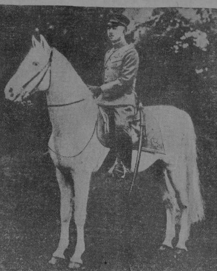
DE LA ACTUALIDAD EN EL JAPON.—Arriba: El almirante Yamamoto, candidato probable a la presidencia del Consejo de ministros.—El general Hishikari, uno de los políticos japoneses que más trabajaron por la instauración del Imperio de la Nueva Manchuria.—A caballo, el emperador Hirohito, en uno de sus más recientes retratos.