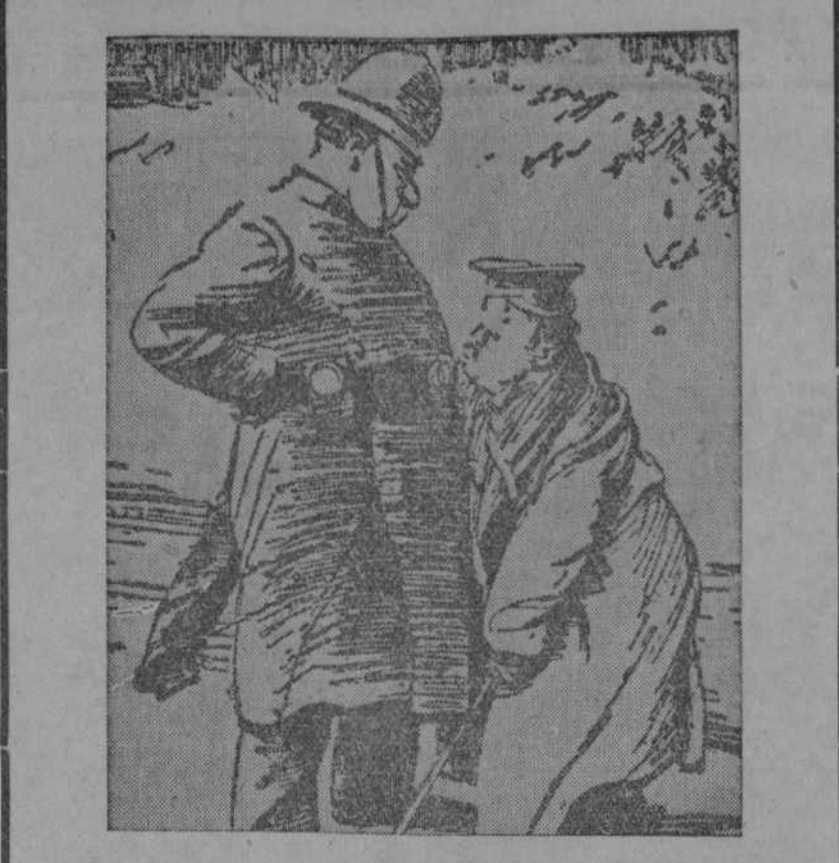
—Yo le he quitado la gorra a un policía, pero tú estás mucho peor que yo, porque le has quitado el cinturón.