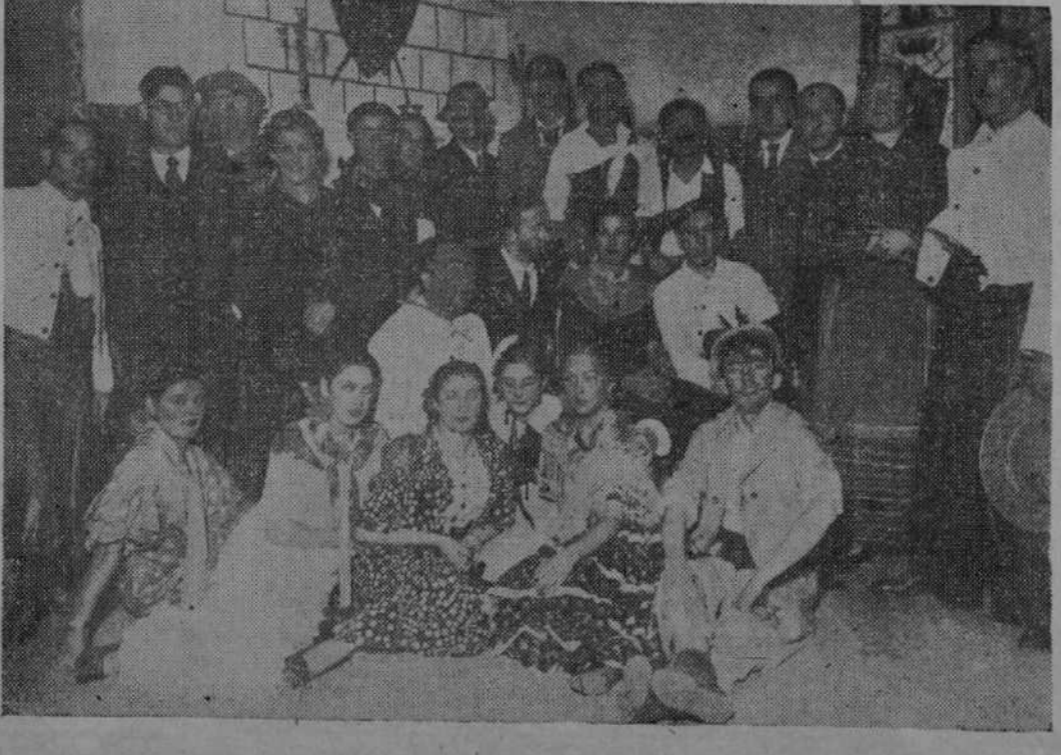
Distinguidos aficionados santoneses que representaron, con gran éxito, la graciosa obra "La Eme"

En la capital actuarán, o habrán actuado a la hora en que aparezcan estas líneas, en Radio Santander, Cafés del Boulevard, Ancora y Español y Casa de Salamanca, sin que por la premura del tiempo lo hayan podido verificar en otros varios locales, a pesar de haber sido solicitados.—A. R. O.