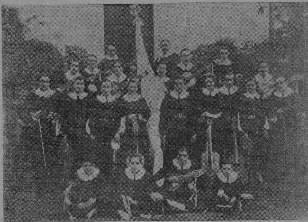
La notable agrupación «Lira Montañesa».