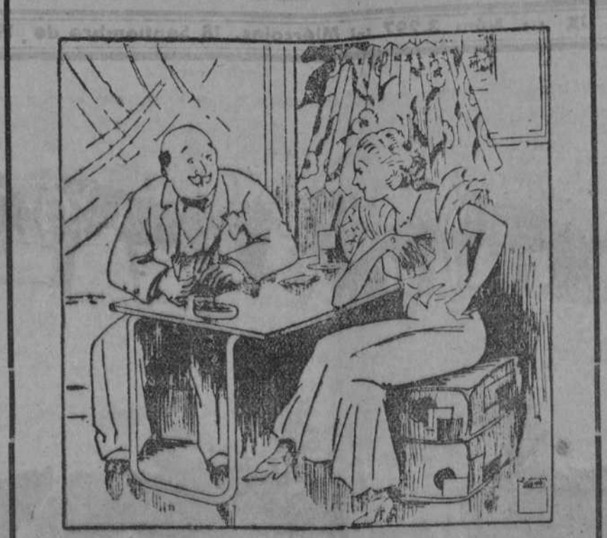
ELLA.—Nos jugaremos un areñardo. Si gano lo elijo yo, y si pierdo lo eliges tú para mí.