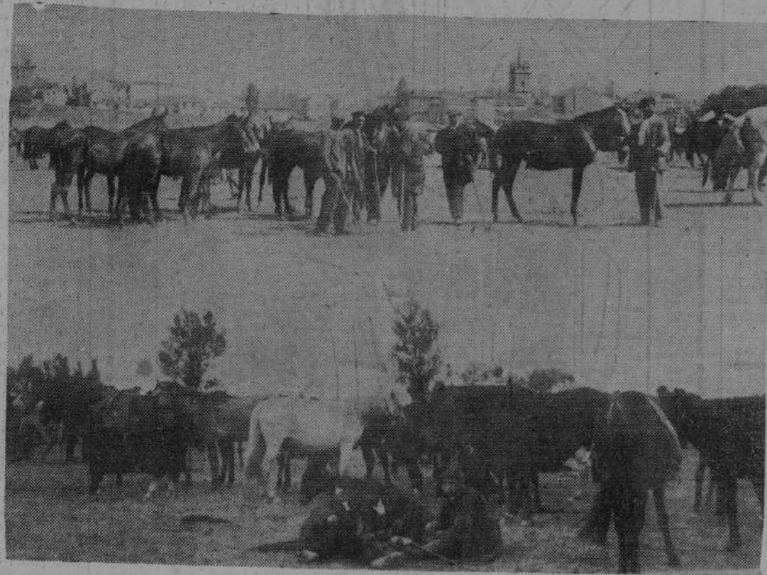
LAS FIESTAS DE SAN MATEO EN REINOSA.—Pasado mañana empiezan en la capital de Campóo, la bella y trabajadora Reinosa, las típicas y tradicionales ferias de San Mateo. La hermosa llanura de Las Heras se llenará de ganado caballar, y los lotes de muletas, yeguas y potrancas serán disputados en sin igual rivalidad por los más famosos ganaderos españoles.