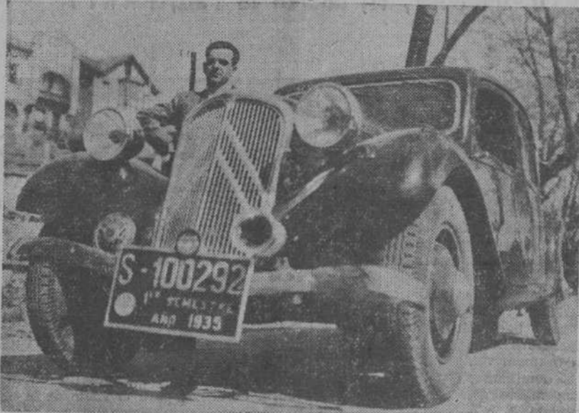
El Citroen 7 Sport, maravillosa producción de la industria francesa, que ha permitido establecer el record Santander-Bilbao a una media de 80 kilómetros aproximadamente a la hora.