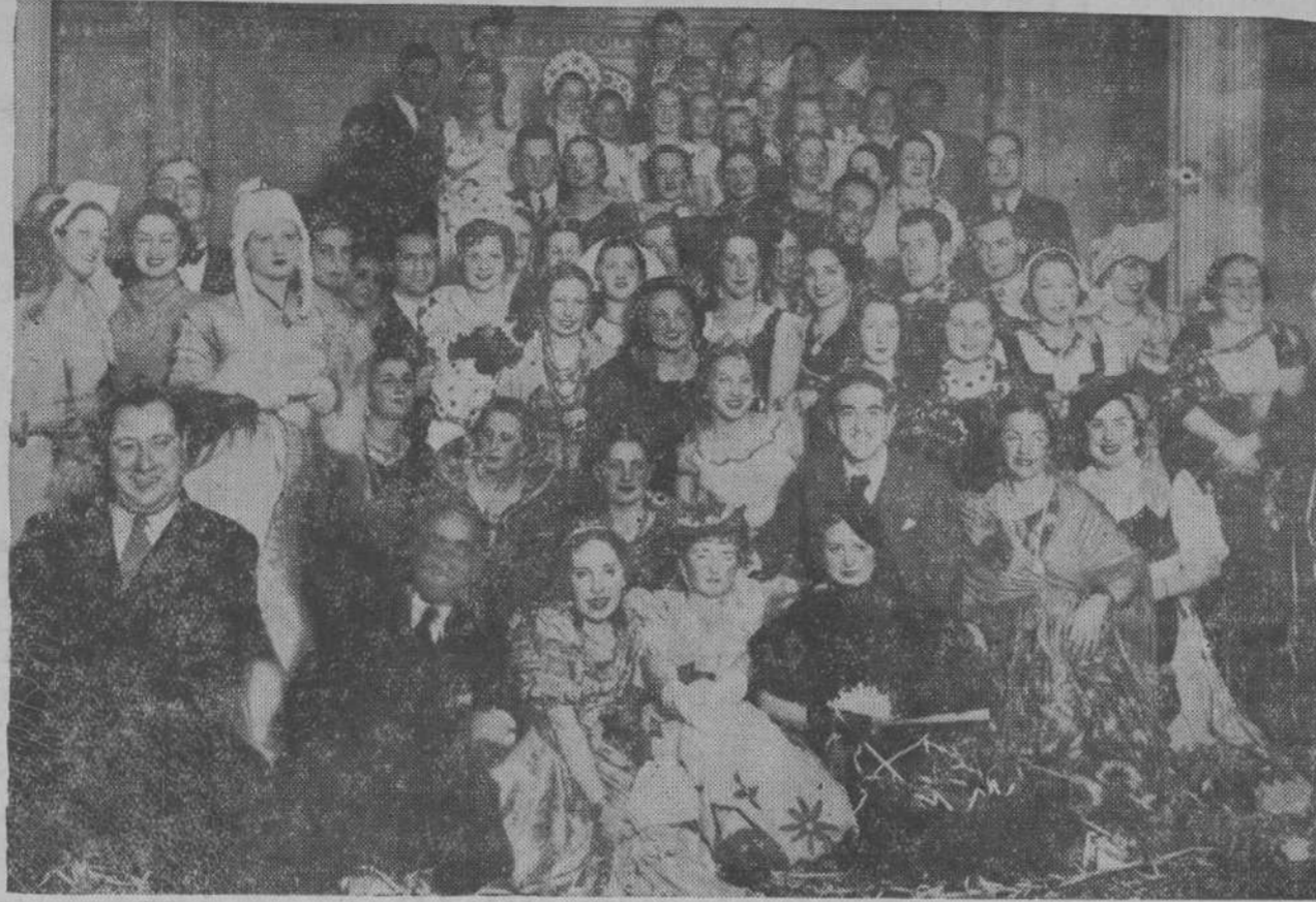
Un grupo de asistentes al brillante baile de máscaras celebrado ayer en el Club de Regatas.