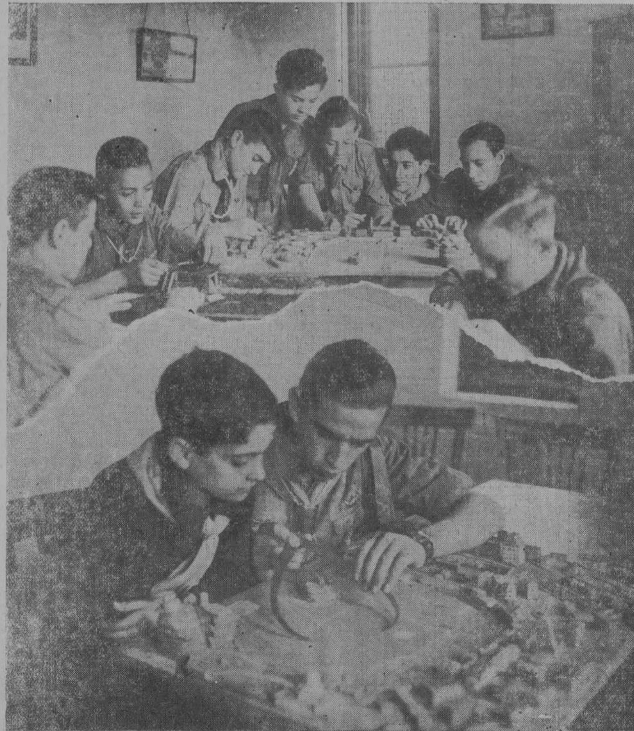
El domingo se celebró en el Cuartel de Exploradores un acto sencillo y cordial: la apertura de la Exposición de trabajos manuales de los «boy-scouts» santanderinos, y cuyos trabajos «expositarán» este año los Reyes Magos en mano, de los niños pobres. Alejandro recog en estas notas dos momentos de interés...