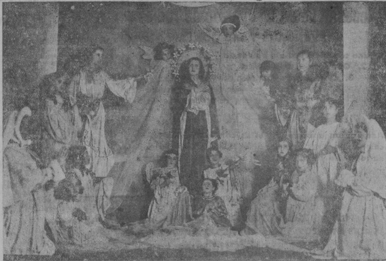
Cuadro plástico, formado por alumnas y ex alumnas del Colegio de los Sagrados Corazones, de Torrelavega, en la función celebrada recientemente.

Impresos de todas clases en la EDITORIAL MONTANESA Marcos Linazasoro, 19. Teléfono 15-35.