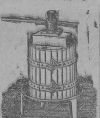
Presas para tela y...