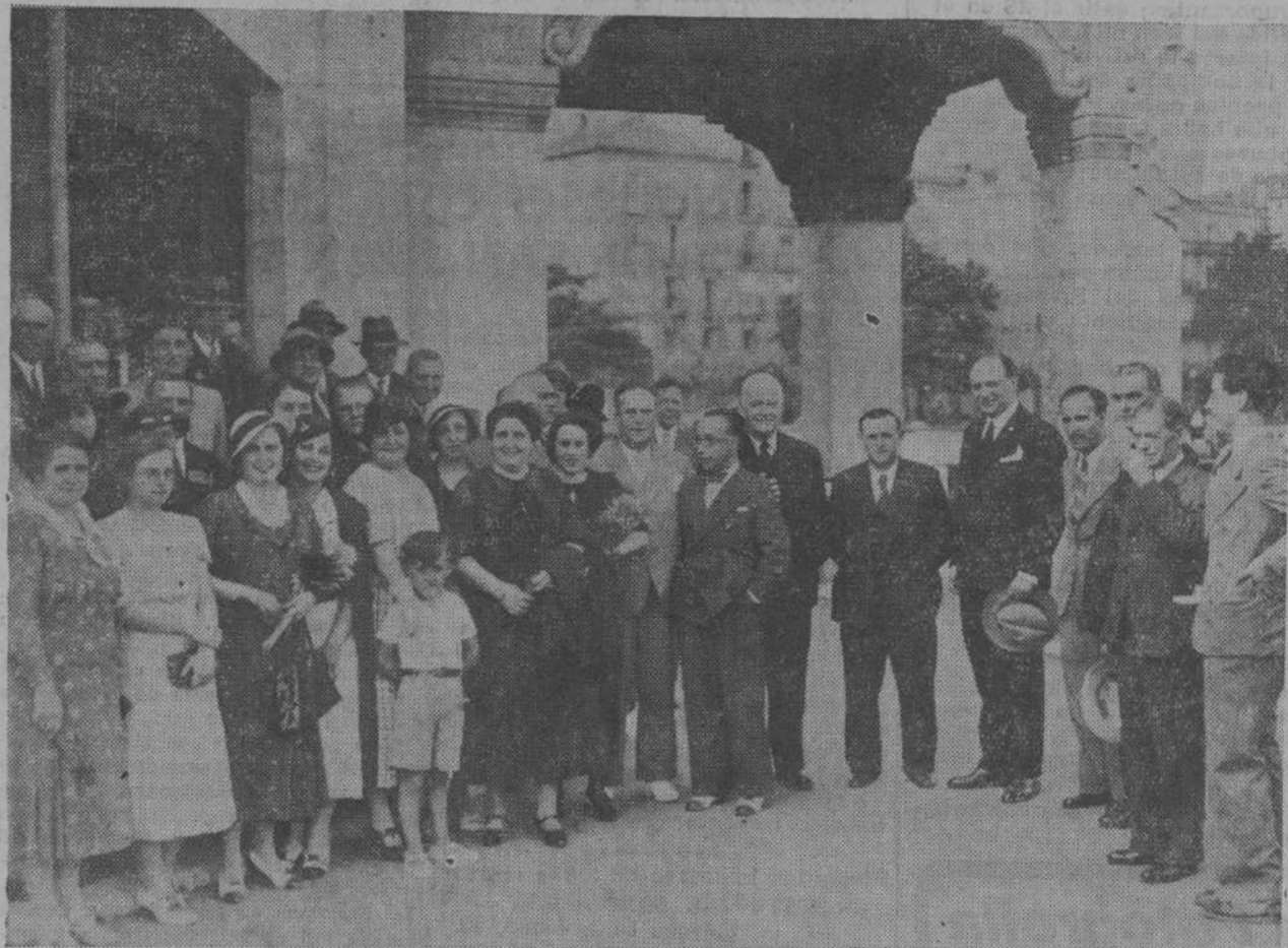
He aquí a los distinguidos excursionistas valencianos llegados ayer—gratísima embajada turística de la ciudad del Turia—, acompañados de las autoridades, en el momento en que se disponen a embarcar para realizar una gira marítima.