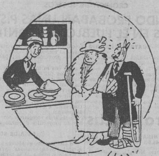
—Quisieramos una vajilla de setenta y cuatro piezas, como la que nos vendió usted ayer.