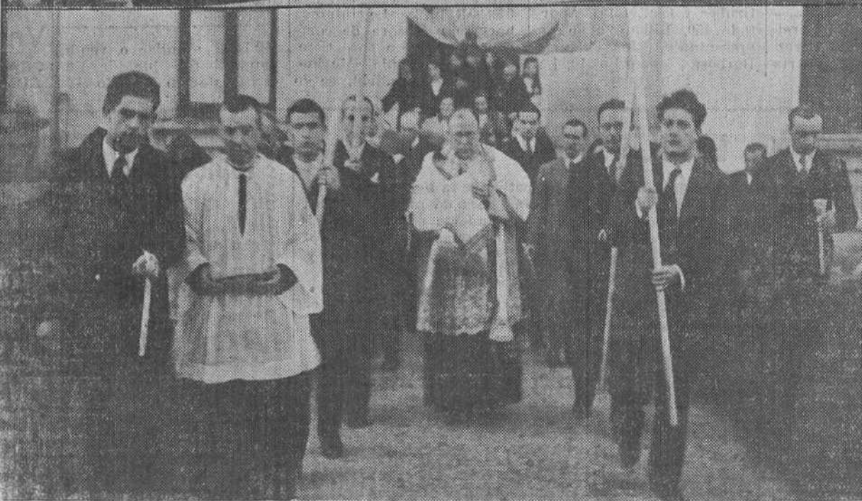
Los enfermos que reciben asistencia en la Casa de Salud Valdecilla y que espontáneamente habían mostrado deseos de cumplir con el precepto pascual, recibieron ayer la comunión de manos del señor obispo. He aquí dos momentos del desfile de la solemne comitiva.