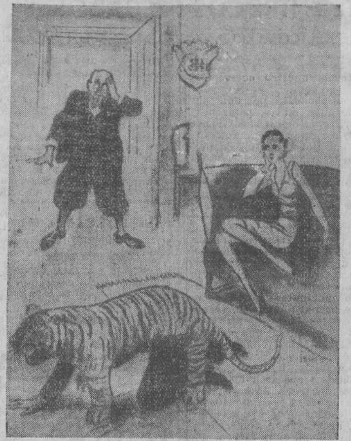
EL PADRE (que llega, inesperadamente).—¡Caracoles! ¡Juraría haberlo matado en la India!...