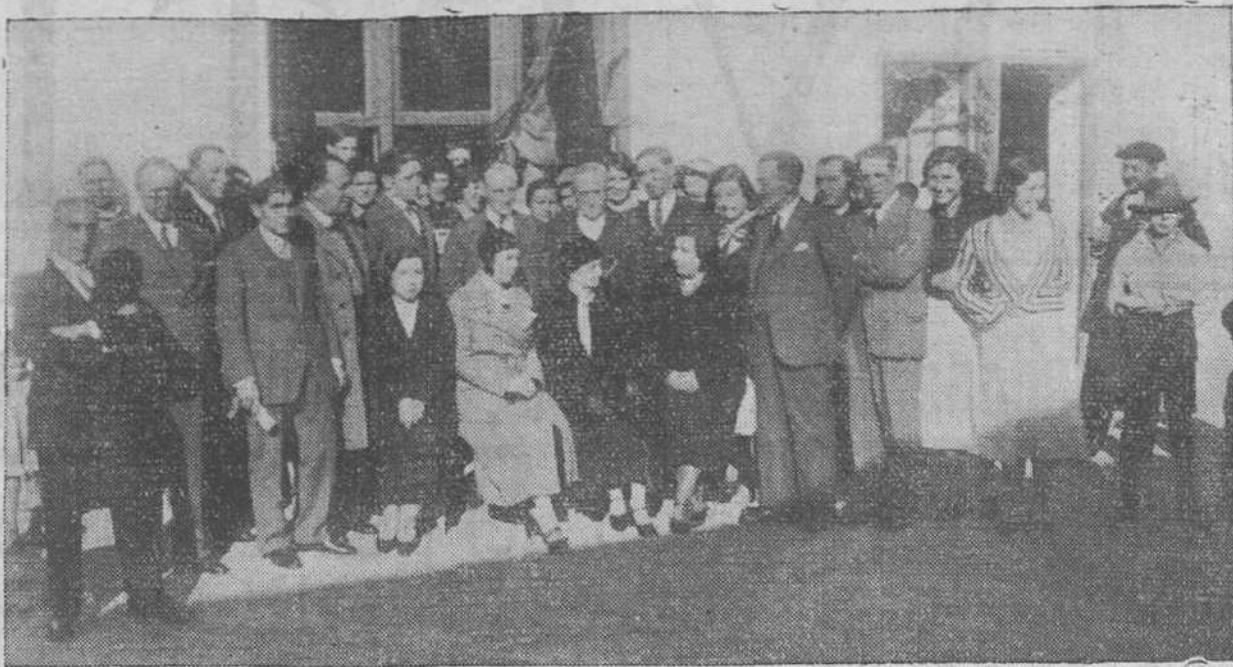
Grupo de inspectores de primera enseñanza, autoridades locales e invitados asistentes el domingo, en Monte, a la inauguración de las cantinas escolares, establecidas gracias a la Sociedad «Amigos del Niño», del mencionado pueblo.

En la mañana del domingo y atendiendo una amable invitación de la Sección de Amigos del Niño, del Ateneo Popular del inmediato pueblo de Monte, asistimos a la inauguración de las cantinas escolares, que tuvo lugar a las doce de la mañana con asistencia de más de 200 niños de ambos sexos y otras numerosas personas.