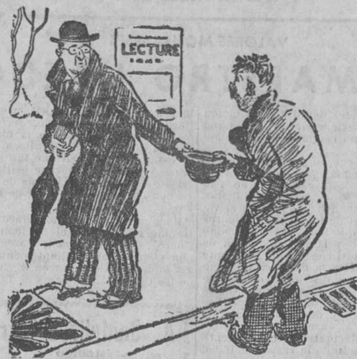
EL SABIO, DISTRAIDO.—¡Ah! Muchas gracias. Ya es la segunda vez que me dajo hoy el sombrero por ahí.