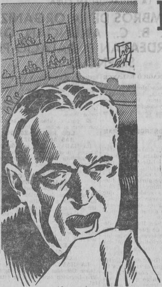
Ni tos ni catarros.

HORAS DE OFICINA Central: De 9 a 1 y de 3 a 5. Sucursal: De 9 a 1 y de 3 a 5. Los sábados, semana inglesa.