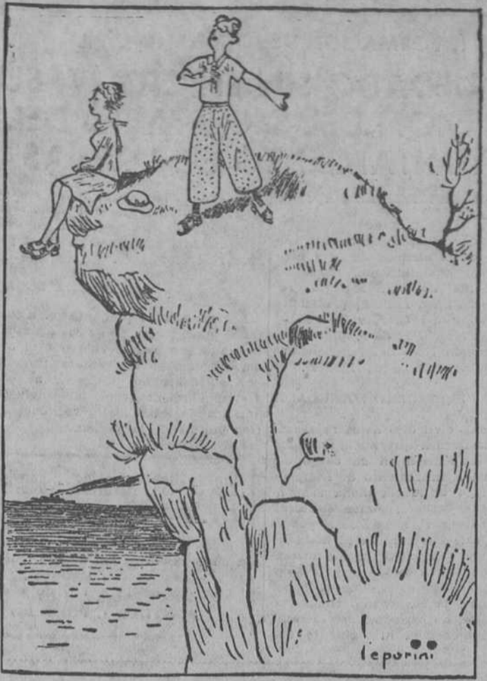
—Dime que me amas, idolatrada Elmegunda, y me echaré a tus pies para besarlos.