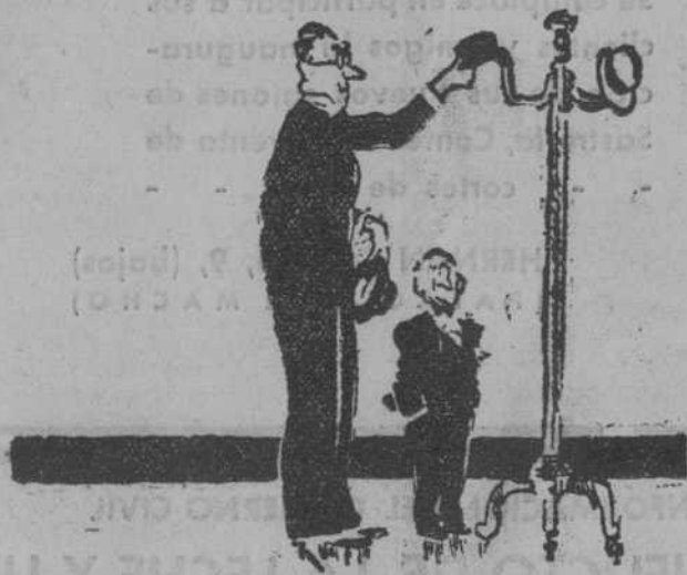
EL SEÑOR ALTO.—Yo se lo colgaré, caballero.