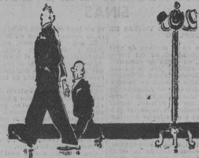
EL SEÑOR BAJO.—Muchas gracias. Cuando tenga que coger algo del suelo ya sabe que estoy a su disposición.