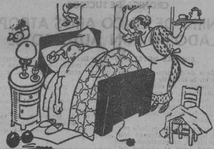
EL DESPERTAR DEL BOXEADOR