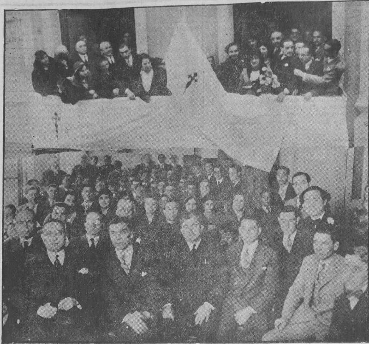
INAUGURACION DE LA CASA DE GALICIA.—El domingo inauguró la colonia gallega su domicilio social. El grabado recoge el momento en que se iza la bandera regional en el balcón de la Casa y un aspecto del salón de fiestas de la misma durante la conferencia pronunciada por el Padre Carballo.