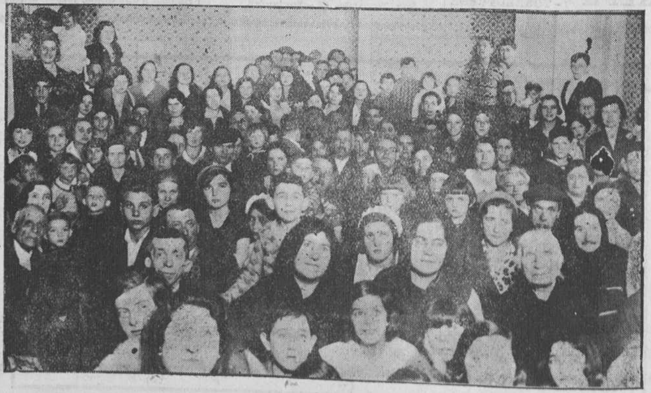
INAUGURACION DE LA CASA ZAMORANA.—El domingo inauguró la colonia zamorana su domicilio social. Un aspecto del salón durante el acto inaugural.

Las inscripciones pueden hacerse en la secretaría, de seis a nueve de la noche, al precio de 2,50, pudiendo ser totales o parciales.