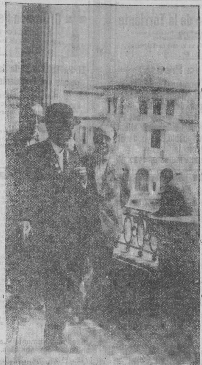
El marqués de Valdecilla recorre la Casa de Salud unos días antes de su inauguración.

Cumplidos los catorce años, el muchacho da por terminada su vida escolar. El maestro ha obtenido de su inteligencia el rendimiento adecuado. Ya pueden realizarse los deseos del padre enviando camino de América al hijo fuerte de cuerpo y vigoroso de espíritu para que uno y otro se pongan a prueba en el gran estadión del trabajo y la voluntad. Precisamente por su línea materna descendía el futuro Marqués de Valdecilla de expertos y acreditados comerciantes. Los Torriente eran una de aquellas familias con escritorio en el Muelle de Santander; y, en América, en la Isla de Cuba, había establecido ramas del mismo linaje que allí han arraigado y uno de cuyos brotes espléndidos ha sido el doctor Cosme de la Torriente,