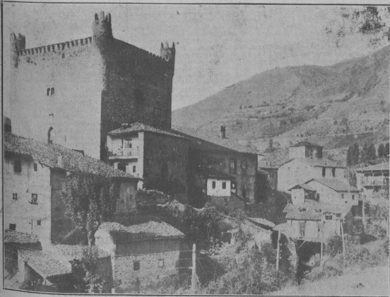
Potes, la hermosa villa, capital de la antigua región lebaniega, eleva al cielo las líneas recias de su torre del Infantado, que da fe de un pasado de grandezas y de recuerdos heroicos.

Los alumnos de la Escuela del Tiro Nacional, de cursos anteriores, que a su debido tiempo no completaron la instrucción o ejercicios de tiro, por enfermedad u otras causas, se presentarán a partir del día 1 de diciembre, a fin de completarla.