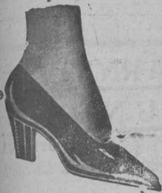
De charol, a 15 pesetas