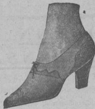
De buena piel de color a 12 pta