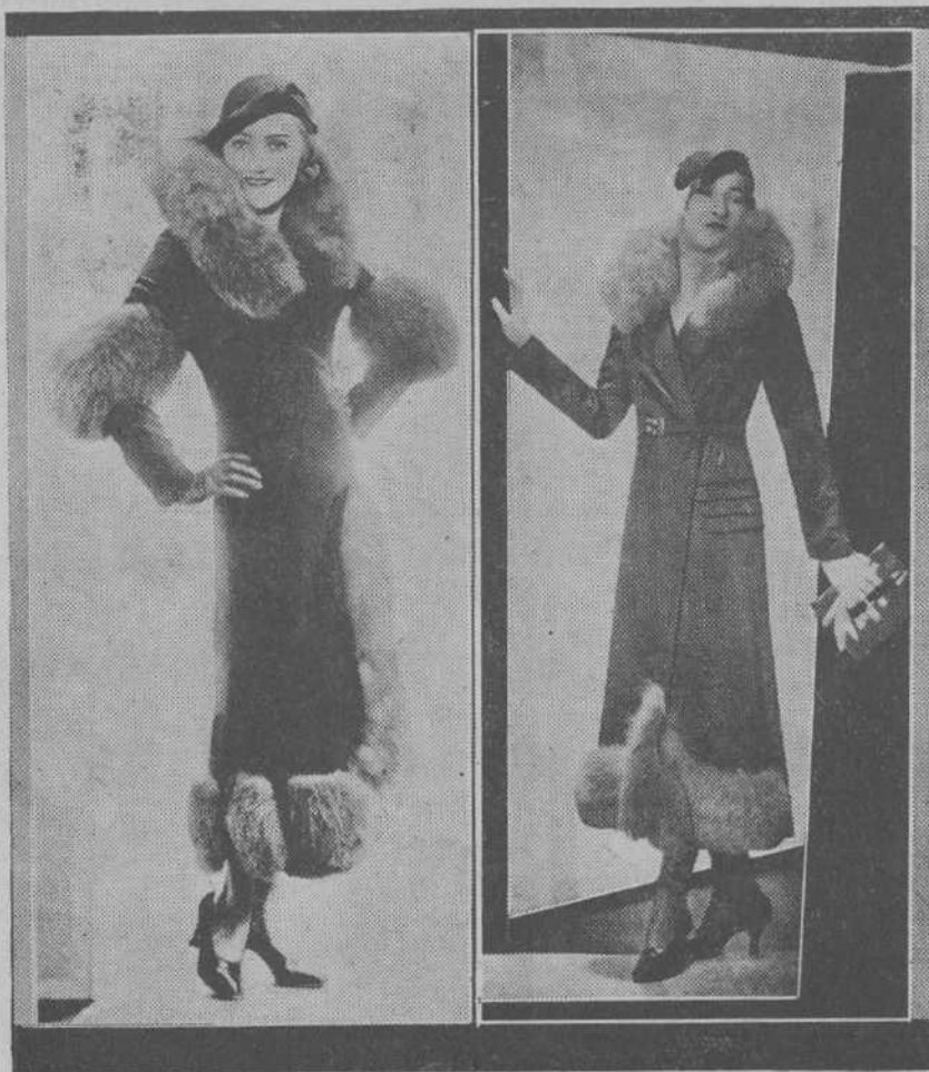
ABRIGOS DE TERCIOPELO, ADRORNADOS CON "RENARD"