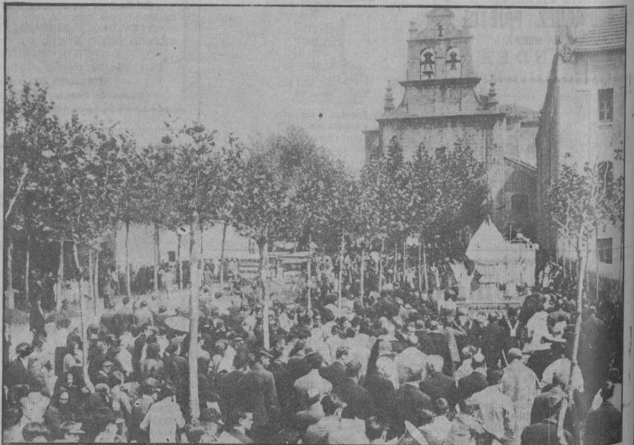
LA VIRGEN BIEN APARECIDA EN MARRON.—Ayer comenzaron las fiestas para celebrar la festividad de la tradicional romería montañesa, que todos los años se ve concurridísima de romeros y romeras de la provincia.

Con esta velada inaugura su temporada artística la simpática Sociedad, temporada que esperamos sea de gran brillantez, dado el entusiasmo y el relieve de sus nuevos dirigentes.