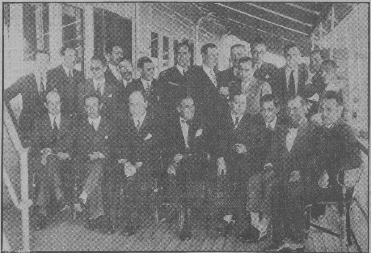
EN EL CLUB MARITIMO—Directivos, jurados y periodistas asistentes a la comida celebrada ayer y con la cual el Club Marítimo cierra su brillante temporada deportiva.

Pocas son las horas que faltan para el cierre de la inscripción y es preciso que todos, como un solo hombre, por el medio que tengamos a nuestro alcance, hagamos por acudir a Cidrad el próximo domingo. Con ello haremos un señalado servicio a los intereses de Cantabria.