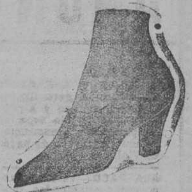
De buena piel de color a 12 ptas

CASA FUENTE Hulea, Alfombras, Cuadros, Espejos. Artículos para regalos.—PUERTA LA SIERRA (frente al Curtido).