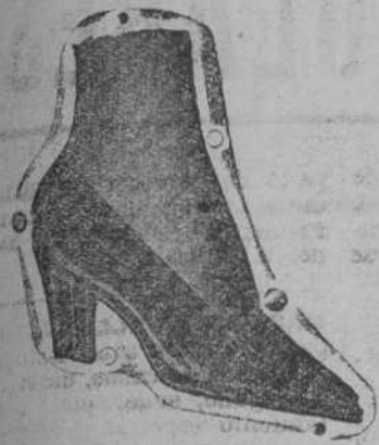
De charol, a 15 pesetas