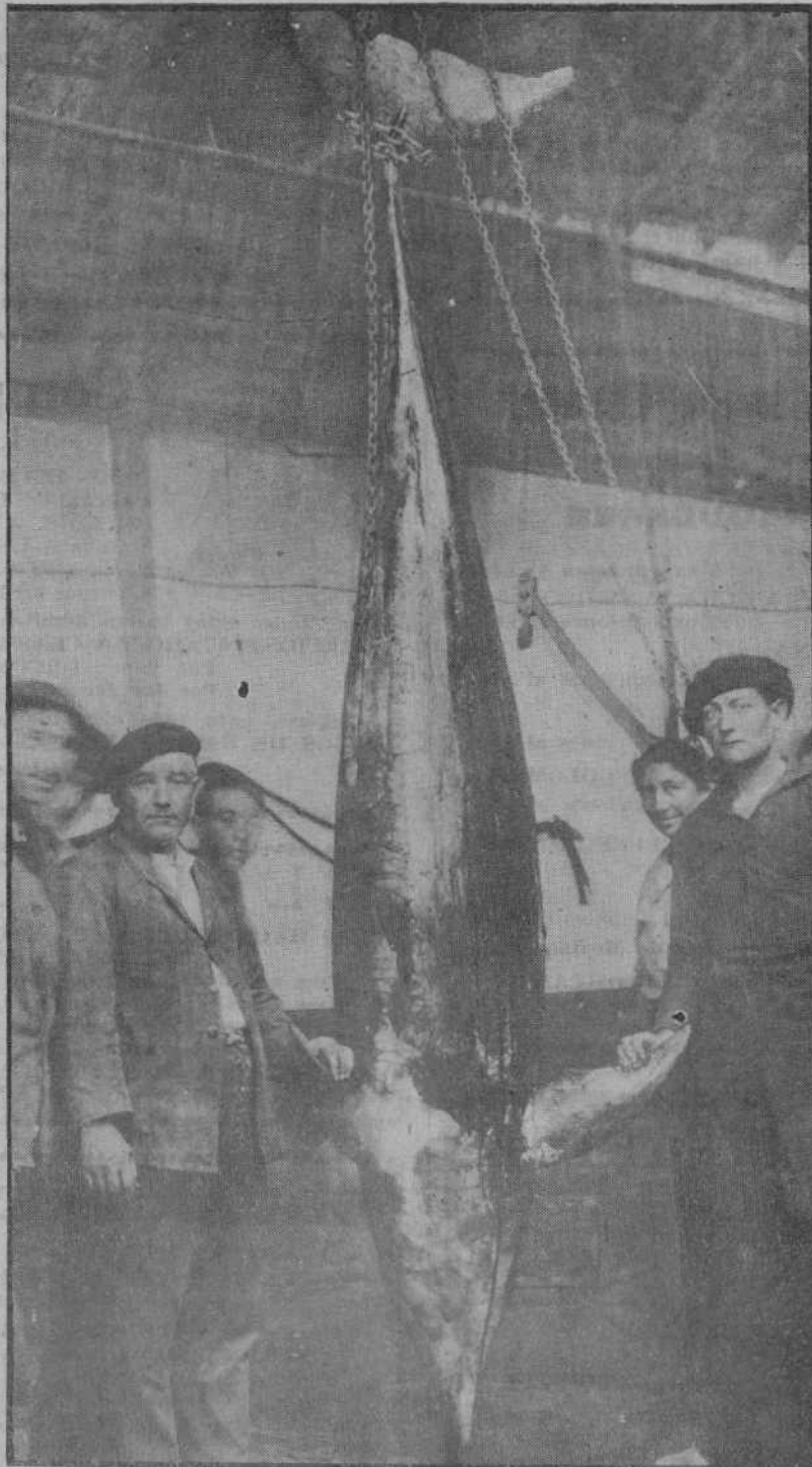
¡El "arguaje" maldito! Este, por lo menos, no nos preocupa más. Y era grande el condenado de él: tres metros y cerca de trescientos kilos de peso. Ahora, que la puntería del señor Iñiguez no entienda de libra más o menos...

Advertimos a los señores que favorecen con el envío de originales que no hemos solicitado, que nos es imposible mantener correspondencia acerca de ellos.