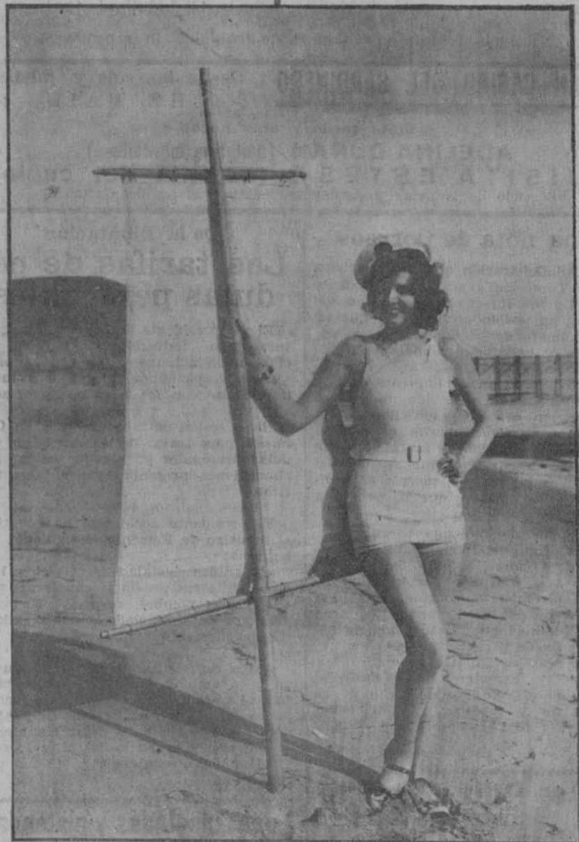
SILUETAS DEL VERANO.—Marinera en la playa, alegoría náutica estilizada—gorra de oficial, mastelero "Hiliput"—, la sonrisa de esta damisela, "star" de la Metro Goldwyn, es, por sí, uno de los grandes prestigios del verano.