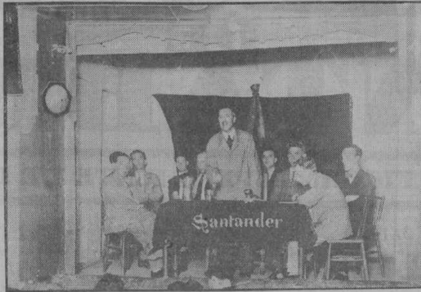
EN LA CASA DEL PUEBLO.—La mesa presidencial del acto de inauguración de la Biblioteca de la Cultural Socialista. El gobernador civil pronunciando su discurso.