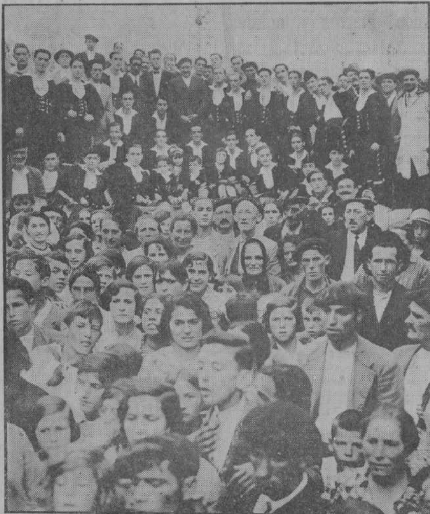
EL HOMENAJE A FLETA EN SUANCES.—El eminente tenor rodeado de la Ronda Montañesa, que el domingo le rindió un sincero y emotivo homenaje.—Un detalle del auditorio que acudió a escuchar el concierto, celebrado al aire libre.