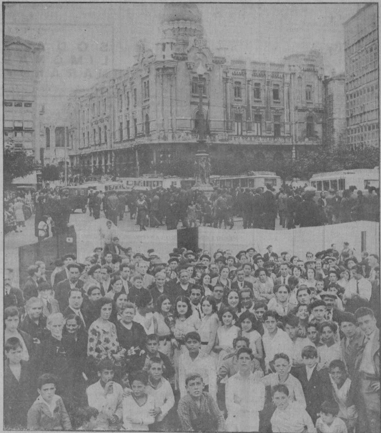
LA EXCURSION ORGANIZADA POR EL ATENEO POPULAR DE BURGOS.—Momento de la llegada a la plaza de Pi y Margall de los doce autobuses que conducían a los expedicionarios.—Un grupo de excursionistas al salir de la Estación de Biología Marítima.

—Hay que gobernar con la cabeza, pero también con el corazón. Los que fueron mis amigos en los días de las vacas flacas serán mis amigos de siempre. Mi ideal es rodearlos de aquellos otros elementos que quieran prestarnos su colaboración y que entre todos formen el gran partido de gobierno que necesita España.