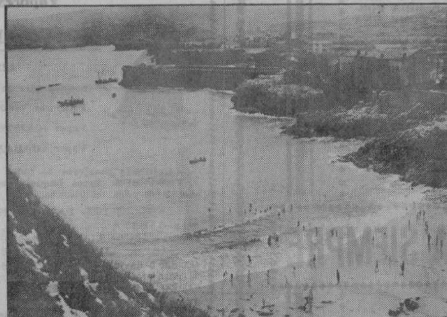
Una de las playas de Llanes, flanqueada de rocas y campos, magníficamente encantadora.