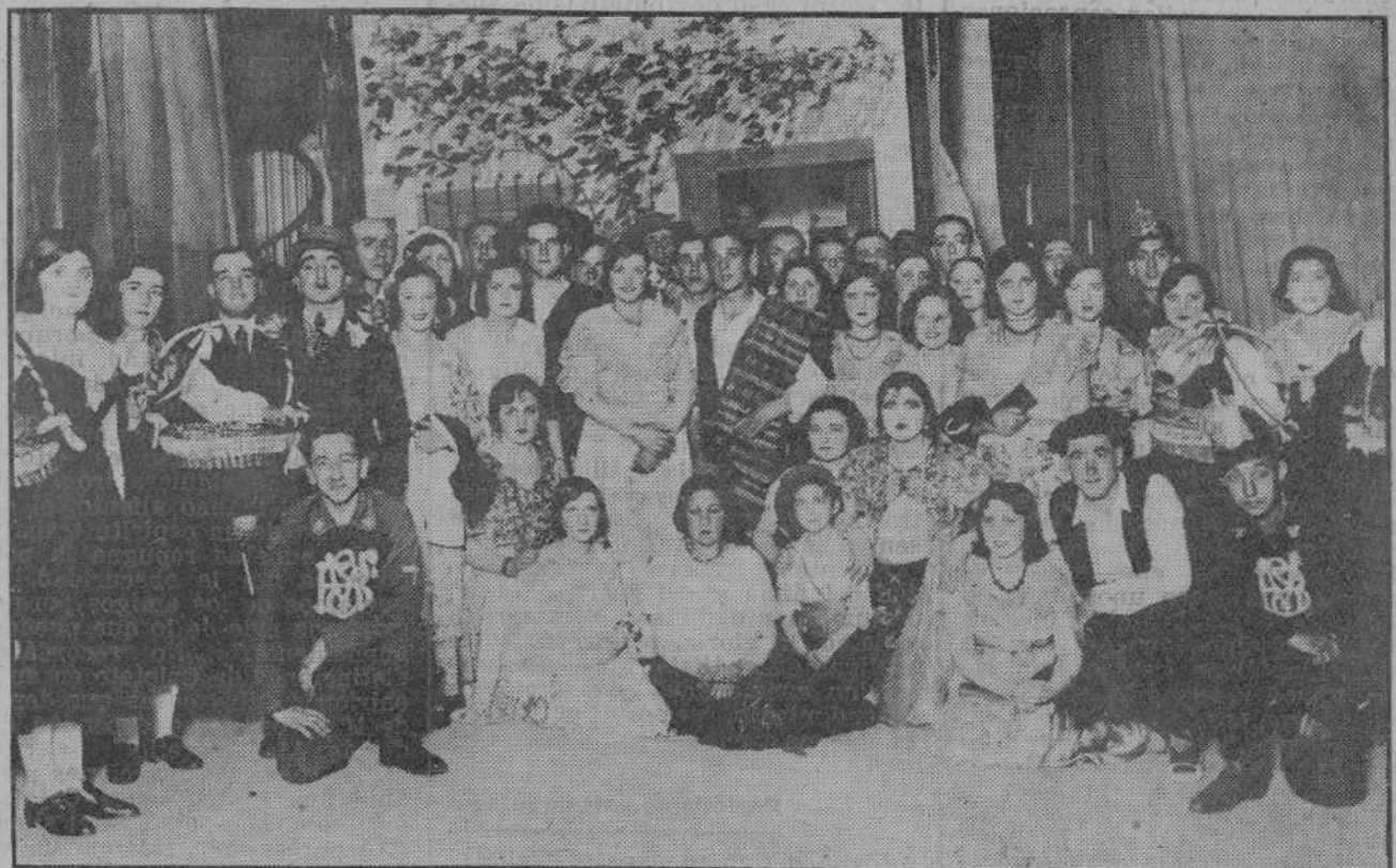
Grupo de bellas señoritas y entusiastas jóvenes que el sábado representaron en el Gran Cinema "La alegría de la Huerta" y "Los Claveles" en la función a beneficio del Cuerpo de Bomberos Voluntarios, obteniendo un verdadero éxito artístico y económico.