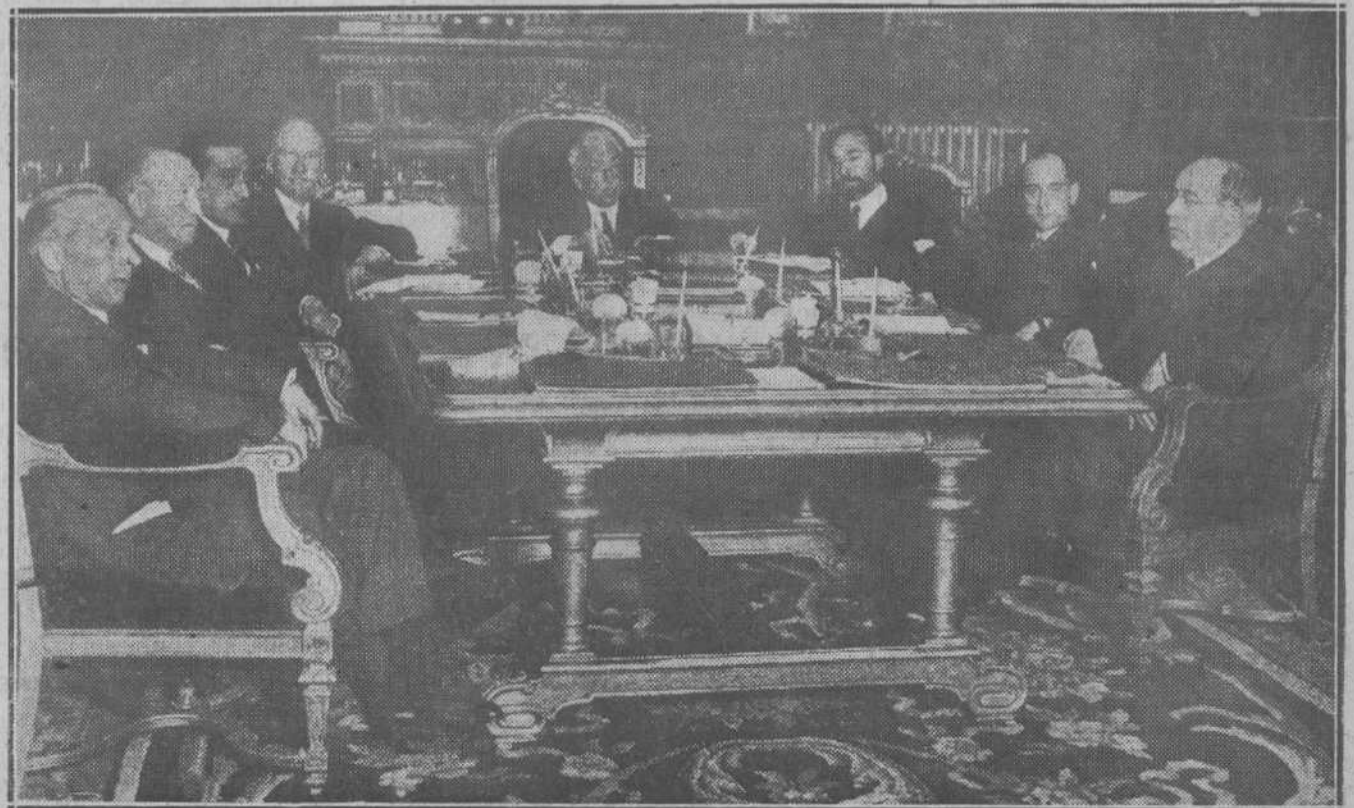
Los ministros del Gobierno provisional de la República durante su primer Consejo, minutos antes de la llegada de los señores Prieto y Domingo.

Por la mañana, el procurador de la defensa busca a su abogado y le cuenta