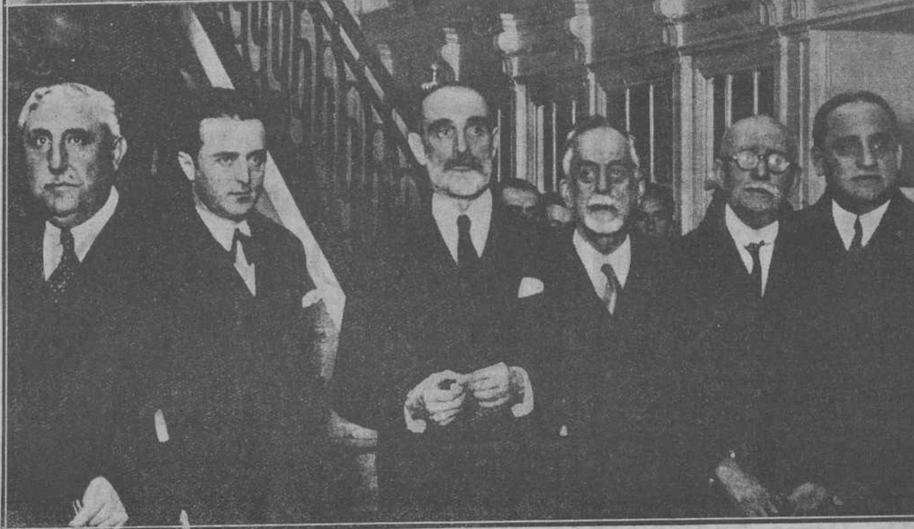
LA ACTUALIDAD EN ESPAÑA.—El vapor "Comercio-Luarca", naufragado a la altura del Cabo Peñas, a consecuencia de un golpe de mar, que le hizo dar una vuelta de campana. De sus siete tripulantes, sólo pudo ser salvado el patrón; de los otros seis no han vuelto a tenerse noticias.—Los señores duque de Maura y Cambó, promotores del nuevo partido "Centro-Constitucional", al salir de la reunión que celebraron, en el Ritz, con los ex ministros mauristas y regionalistas para la constitución del nuevo partido, que, a partir de este momento, intervendrá en la política española.