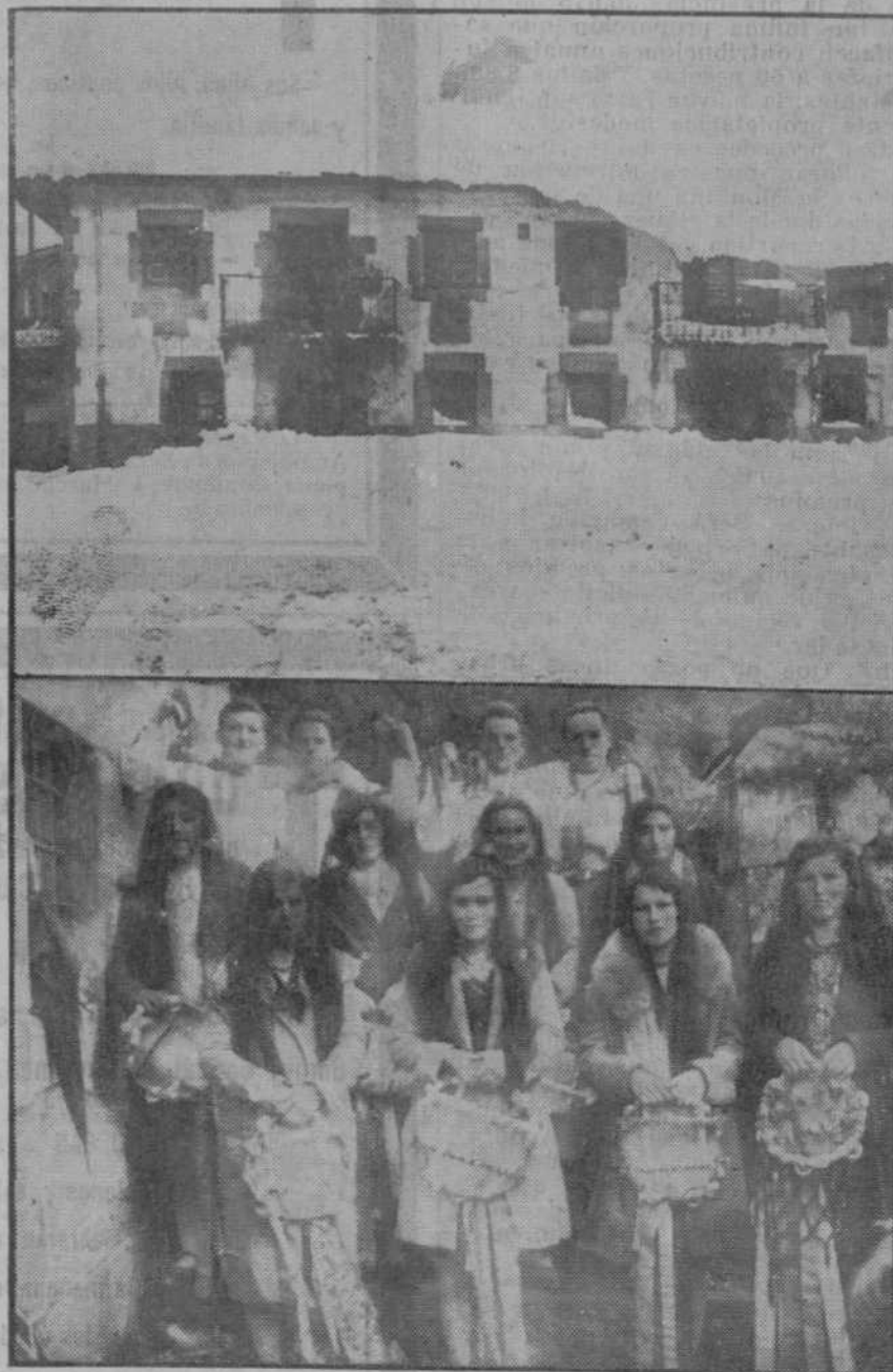
LA ACTUALIDAD EN LA PROVINCIA.—Aspecto de una calle de Reinosa durante las nevadas de estos días.—Jóvenes que cantaron y bailaron los «picayos» en la romería de Virgen de la Peña.

Estos casos son frecuentes en la provincia de Santander, y por ello no es de extrañar que, no obstante su reducido perímetro, de los 350.000 habitantes que la pueblan, 45.563 sean propietarios de fincas urbanas, número éste realmente extraordinario si se tiene en cuenta que el término medio de las personas que componen una familia en