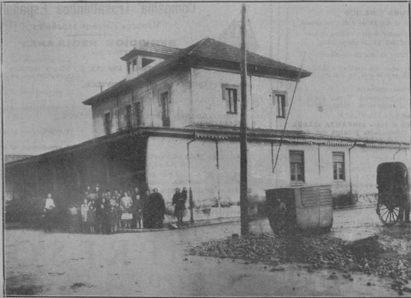
Los pescadores santoñeses cuentan con un edificio social magnífico y bien situado...