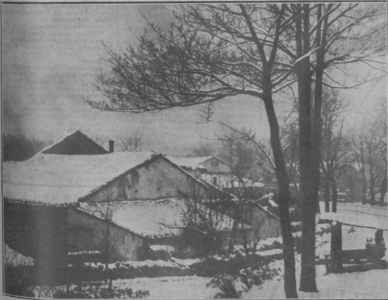
ESTAMPAS MONTANESAS.—La aldea nevada.