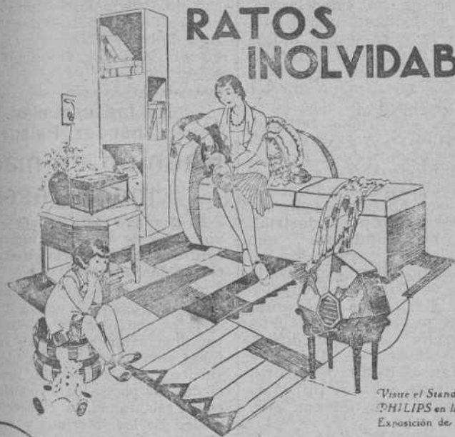
Visite el Stand PHILIPS en la Exposición de Sevilla

Ratos inolvidables de deleite espiritual proporcionan a sus poseedores el RECEPTOR PHILIPS DE LUJO, CON ENCHUFE A LA LUZ Y CON ALTAVOZ ELECTRODINÁMICO. Los más grandes artistas dentro de cada hogar, con fidelidad asombrosa de reproducción y a través de un aparato que es realmente un objeto de arte.