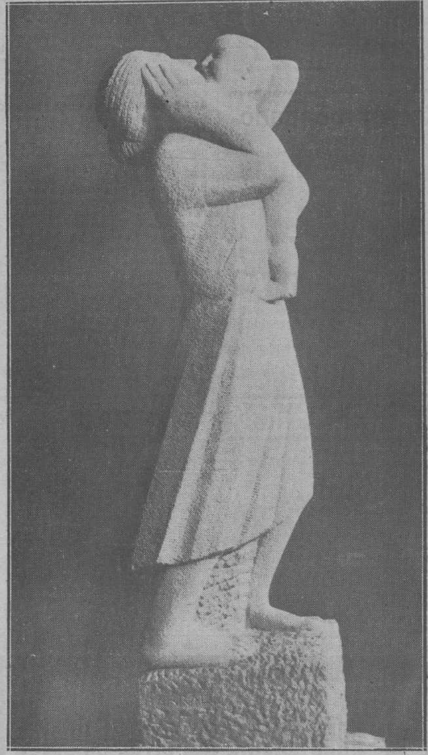
"Maternidad", admirable escultura de Emiliano Barral, propiedad del doctor Vital Aza.

Esta cabeza fué la clave del grandioso monumento que concibió después y que se está construyendo en Madrid por suscripción entre los afiliados de la Unión