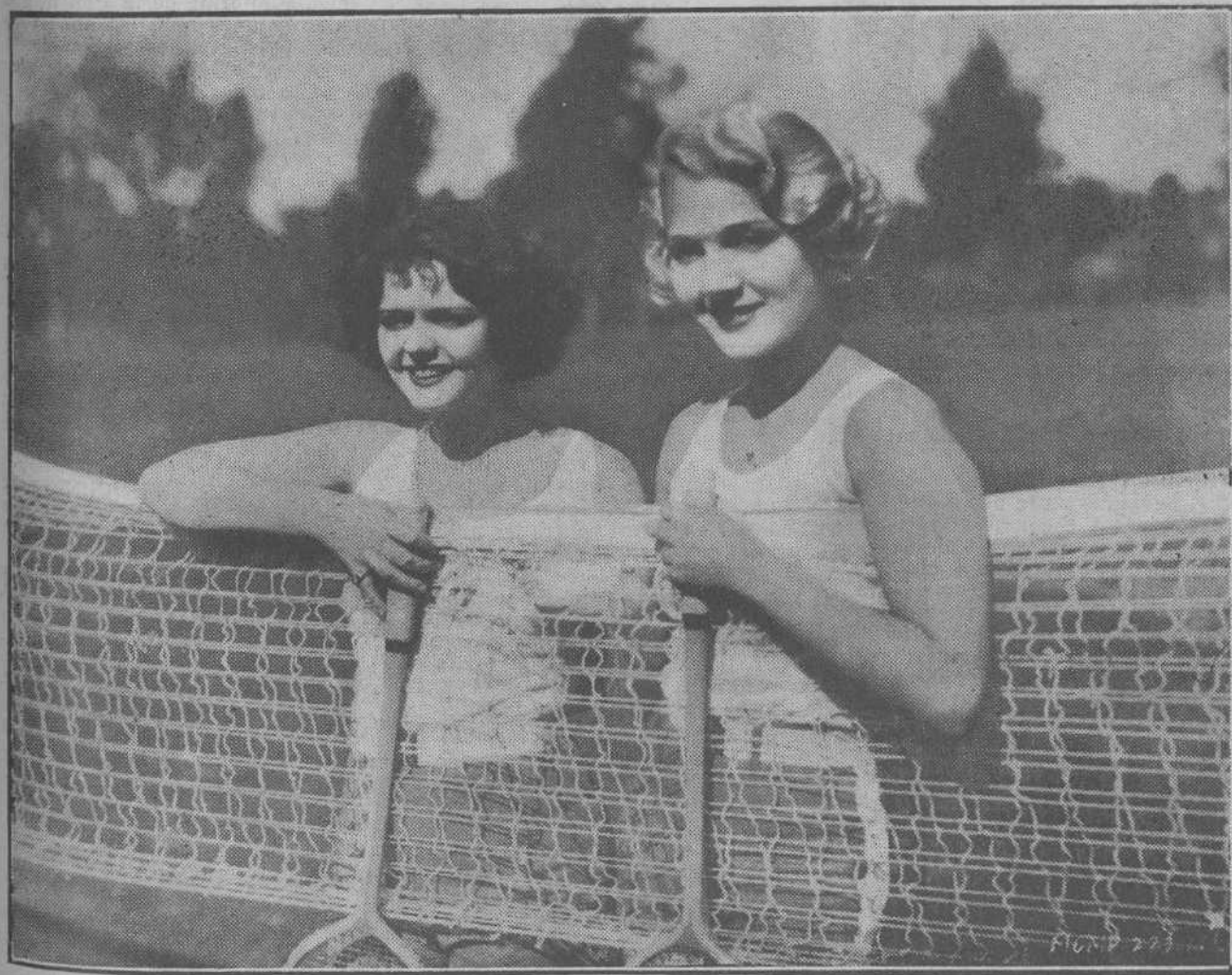
LA MUJER Y LOS DEPORTES.—He aquí a las encantadoras «estrellas» de la Metro en un descanso durante una partida de «badington», juego que actualmente hace furor en Hollywood. Este juego es muy semejante al «tennis», sólo que se usan raquetas de mango largo y bolas de corcho, decoradas con plumas.

LEA USTED EN NUESTRAS PLANAS DE INFORMACION TELEFONICA LAS ULTIMAS NOTICIAS DE ESPAÑA Y EL EXTRANJERO