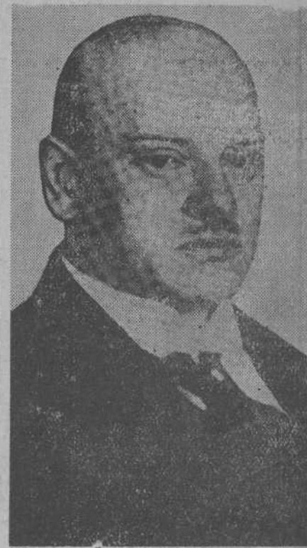
GUSTAVO STRESEMANN el gran estadista alemán que acaba de morir.

Agradecemos la invitación que hemos recibido para asistir al acto.